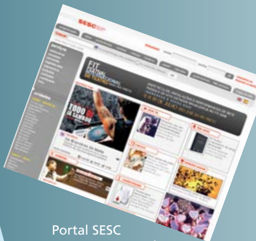
Portal SESC www.secsp.org.br