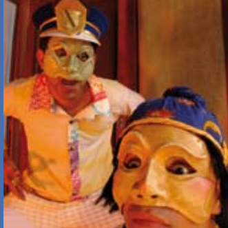
As Aventuras de Urashima Taro