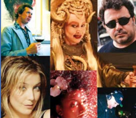
Buzina da Pompéia