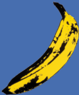
The Velvet Underground & Nico

Série de curtas “científicos” da televisão americana dos anos 60 que mostra de forma didática (e involuntariamente bizarra) os males que as drogas causam no ser humano. LSD: Case Study , 1969, 4min.; LSD: Insight or Insanity? , 1969, 15min.; Narcotics: Pit of Despair , 1967, 12min. Barbiturates: Case Study , 1969, 2min.; Marijuana , 1968, 22min.; Amphetamines , 1969, 3min.; Heroin: Case Study , 1969, 4min. 16 anos. 8h.