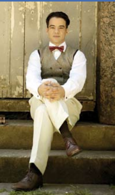
Frederico Garcia Lorca: Pequeno Poema Infinito