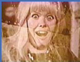
Alice in Acidland

Uma bela jovem, ajustada e inteligente, vê sua vida pacata se expandir para novos e perigosos horizontes. Um grupo de amigos a leva para uma viagem além do País das Maravilhas. 18 anos. 17h30.