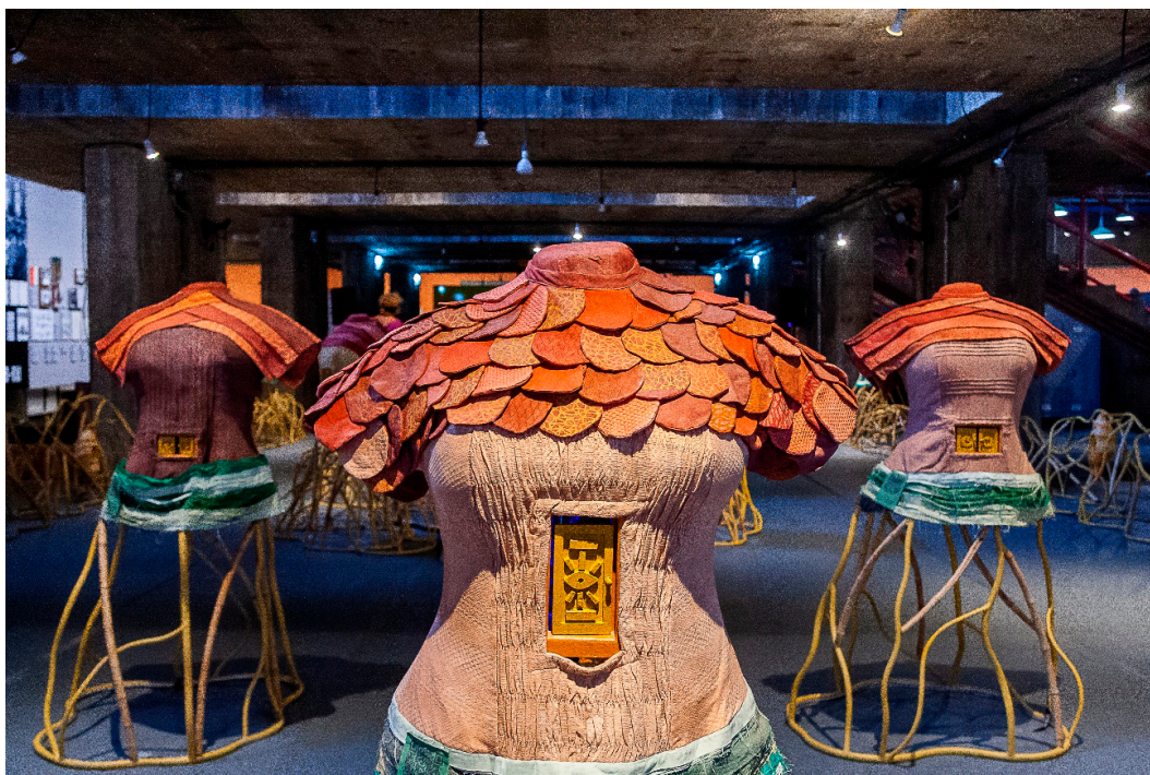
Imagem 4 - A Cidadela