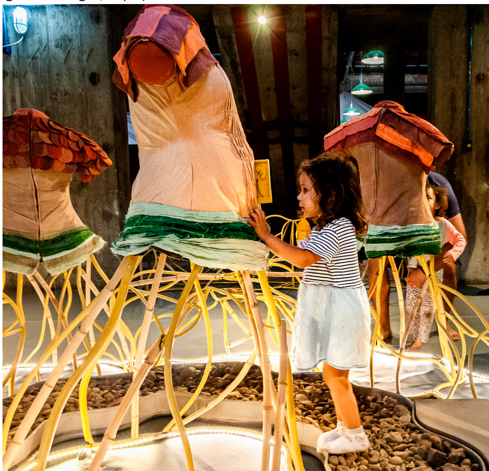
Imagem 3 - Lugar, Espaço e Território