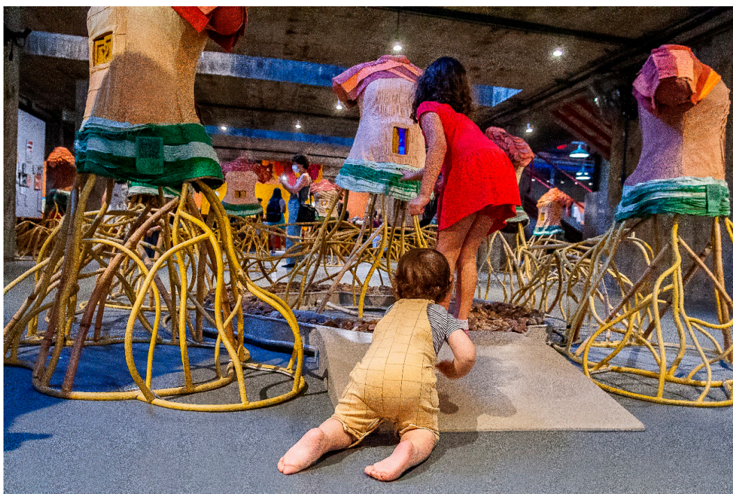
Imagem 8 - Fazer