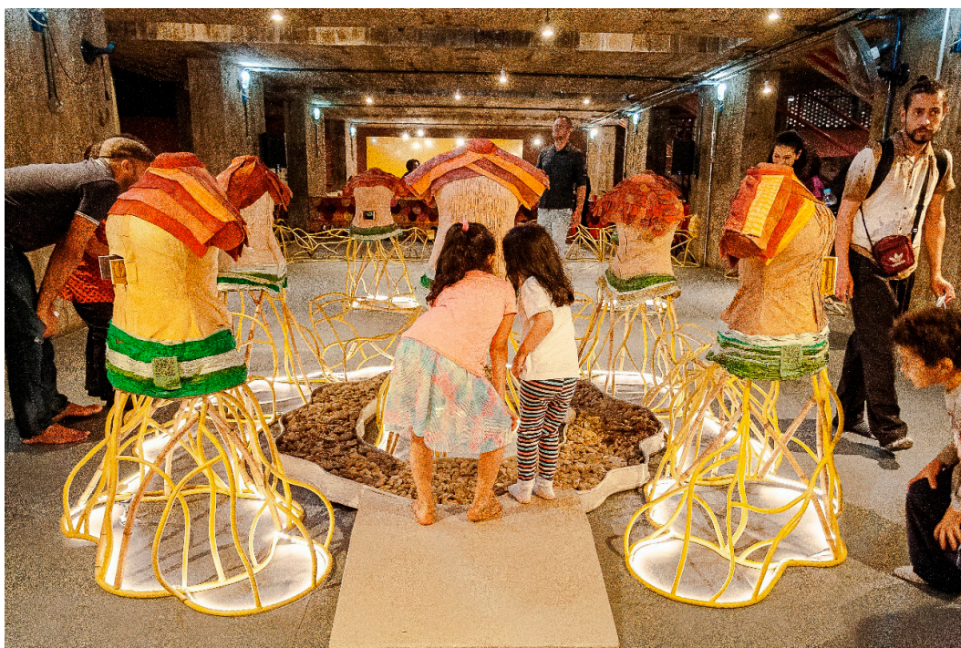
Imagem 9 - Formação de Público