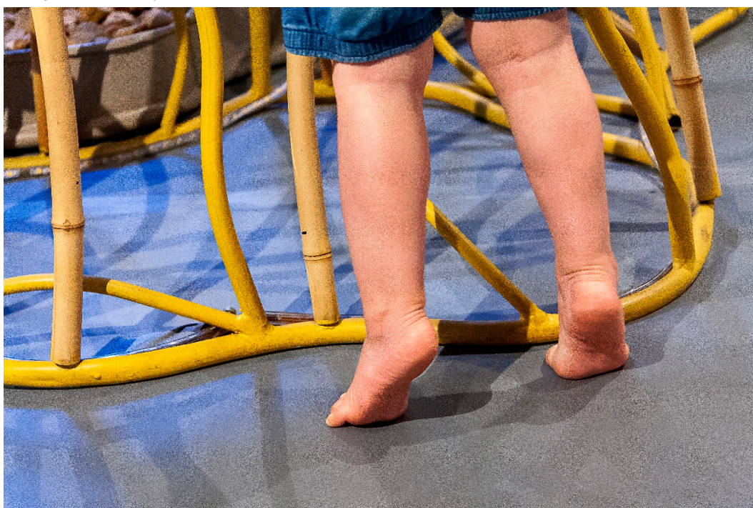
Imagem 7 - Corpo e Território