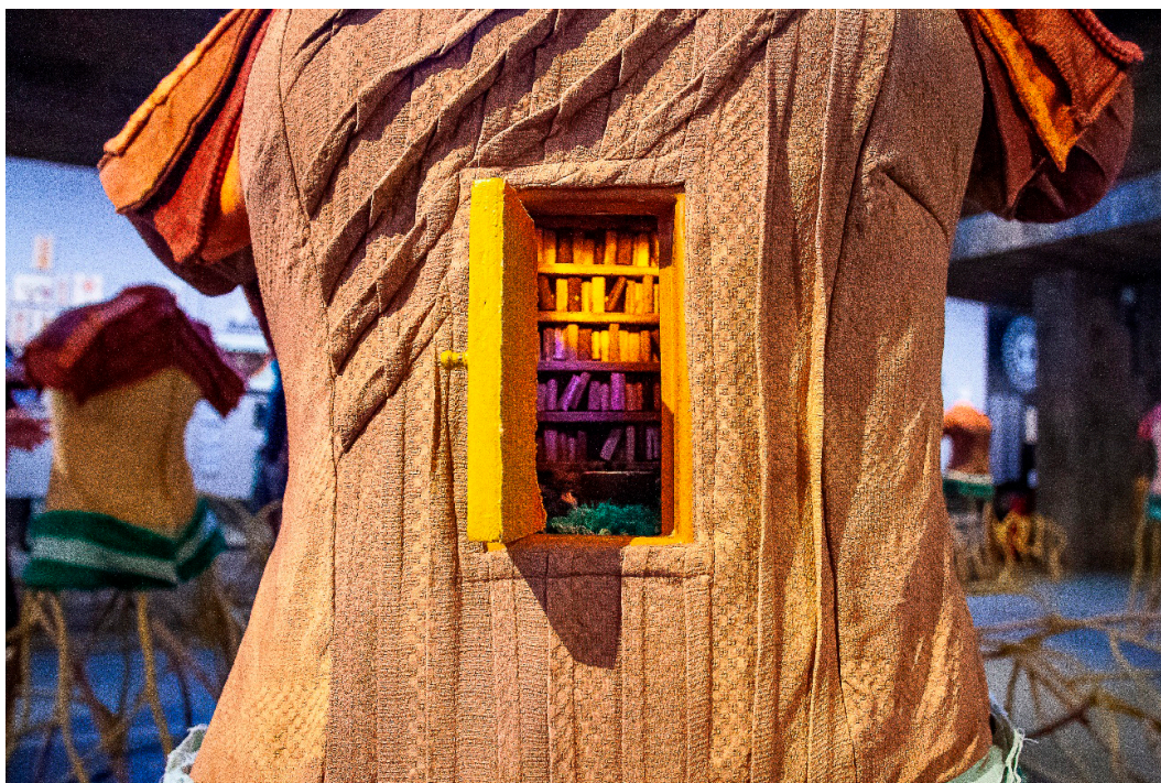
Imagem 6 - Interesses - Minimundo