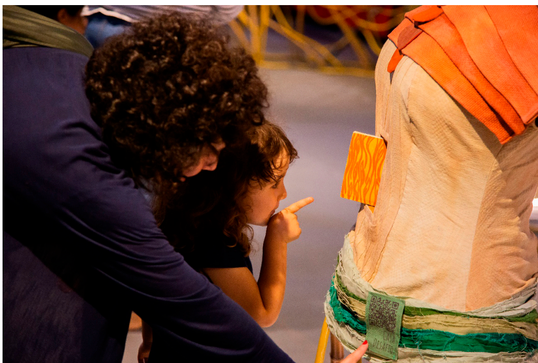
Imagem 11 - Mediação