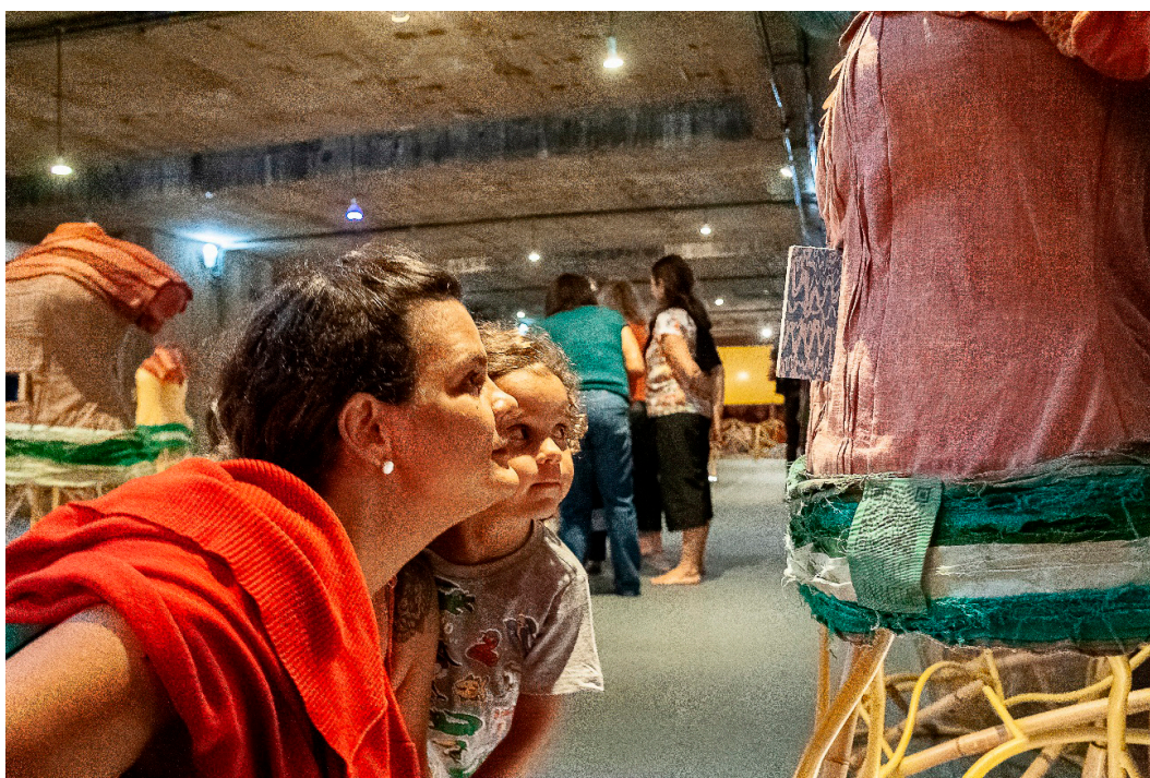
Imagem 5 - Escala