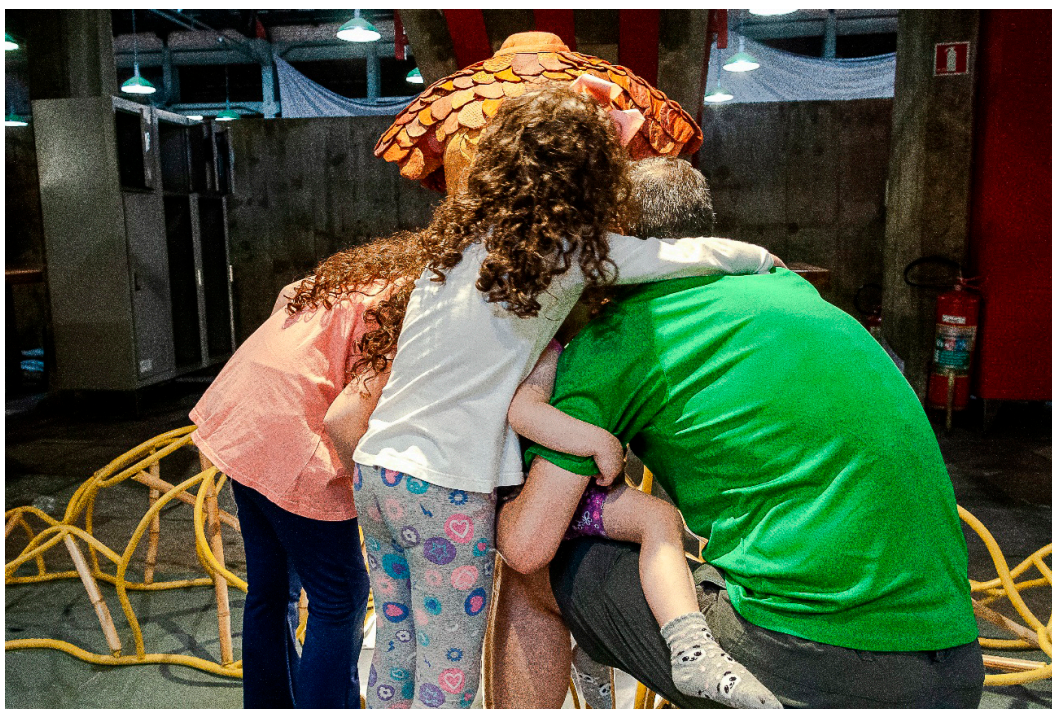
Imagem 10 - Público Ponte