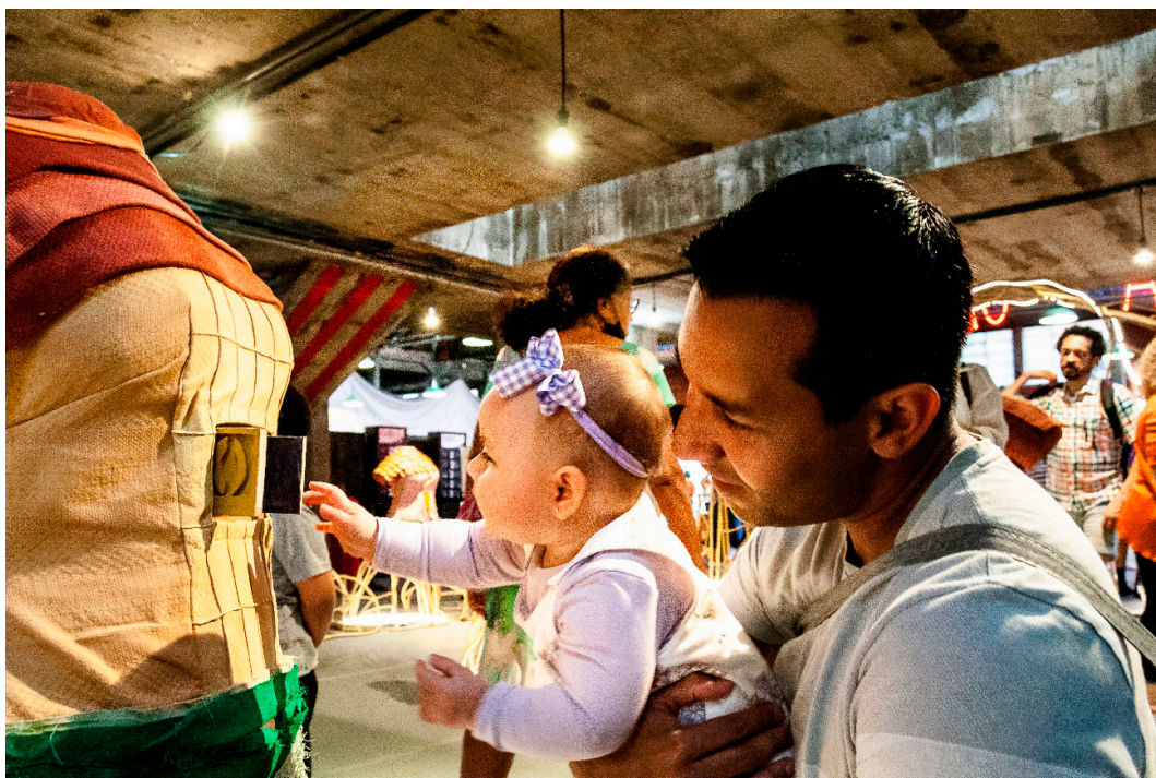
Imagem 12 - Os Caminhos das Artes para as Infâncias