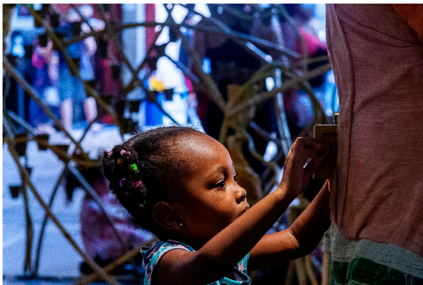
Imagem 1 - Lugar, Arte e Infância