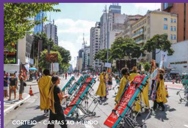
CORTEJO - CARTAS AO MUNDO