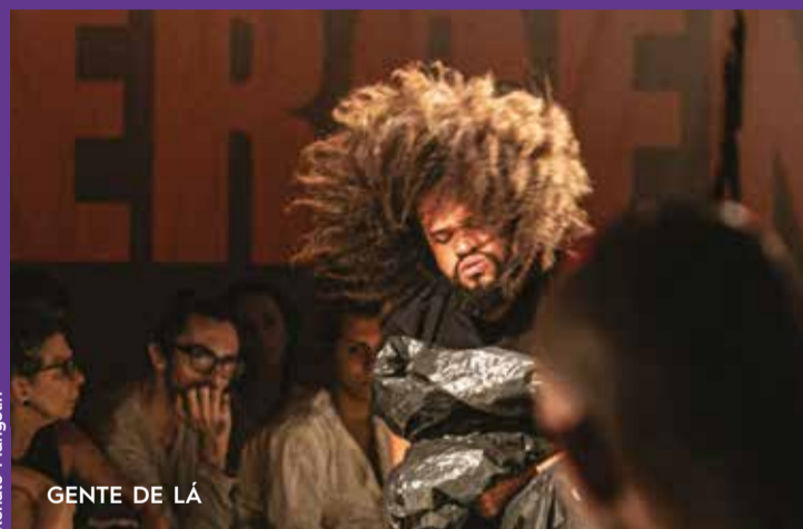
GENTE DE LÁ