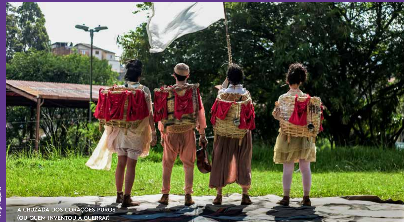
A CRUZADA DOS CORAÇÕES PUROS (OU QUEM INVENTOU A GUERRA?)