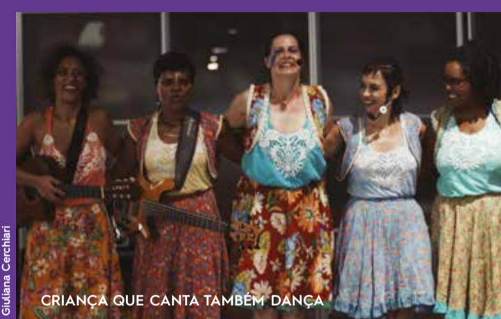
CRIANÇA QUE CANTA TAMBÉM DANÇA