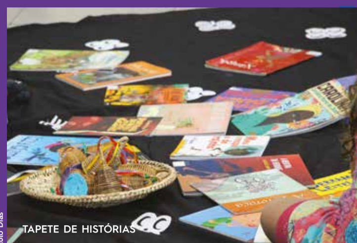
TAPETE DE HISTÓRIAS