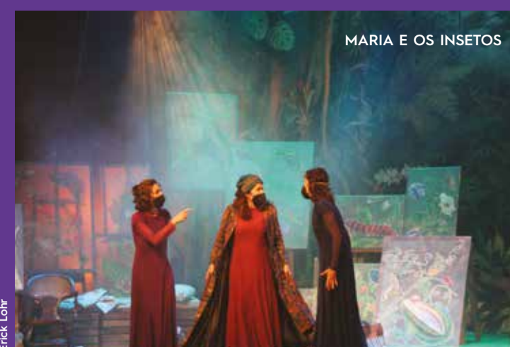
MARIA E OS INSETOS