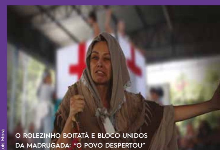
O ROLEZINHO BOITATÁ E BLOCO UNIDOS DA MADRUGADA: "O POVO DESPERTOU"