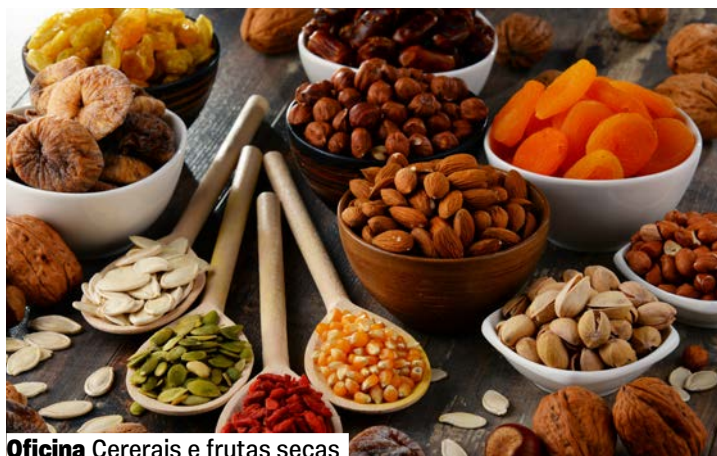
Oficina Cereais e frutas secas