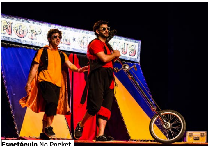
Espetáculo No Pocket