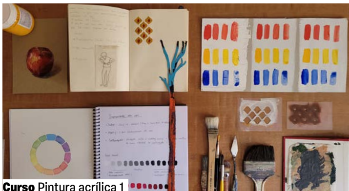
Curso Pintura acrílica 1