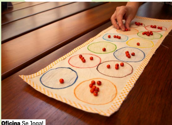
Oficina Se Joga!