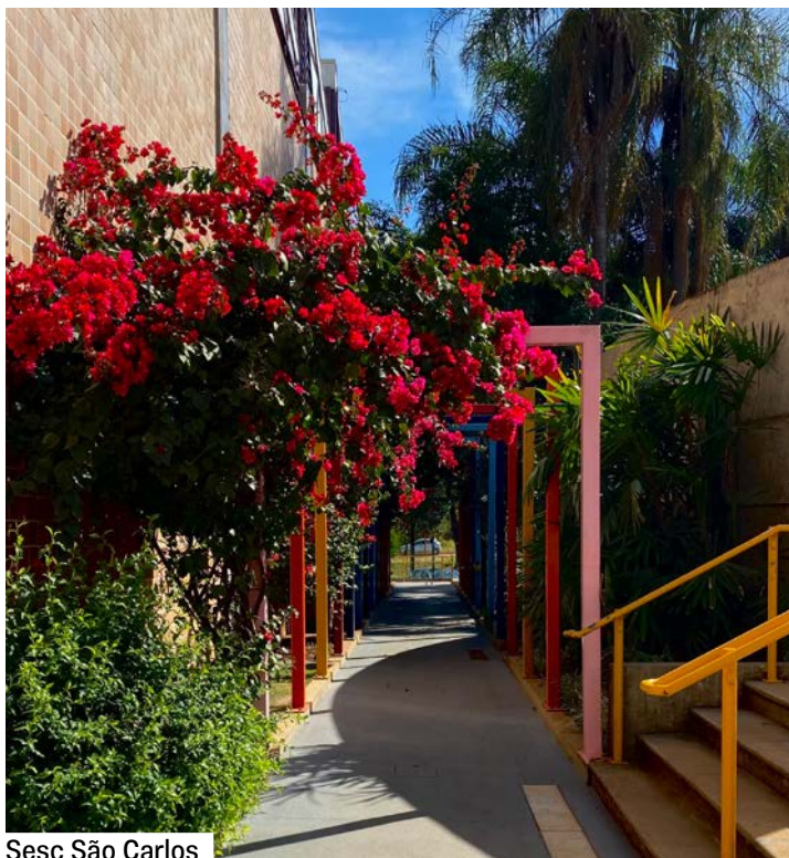
Sesc São Carlos

Mantido pelos empresários do setor, o Sesc é uma entidade privada que atende cerca de 30 milhões de pessoas por ano. Hoje, aproximadamente 50 organizações nacionais e internacionais do campo das artes, esportes, cultura, saúde, meio ambiente, turismo, serviço social e direitos humanos contam com representantes do Sesc São Paulo em suas instâncias consultivas e deliberativas.