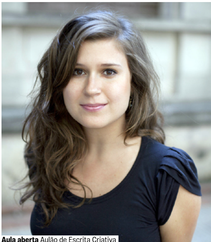
Aula aberta Aulão de Escrita Criativa