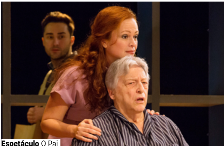
Espetáculo O Pai