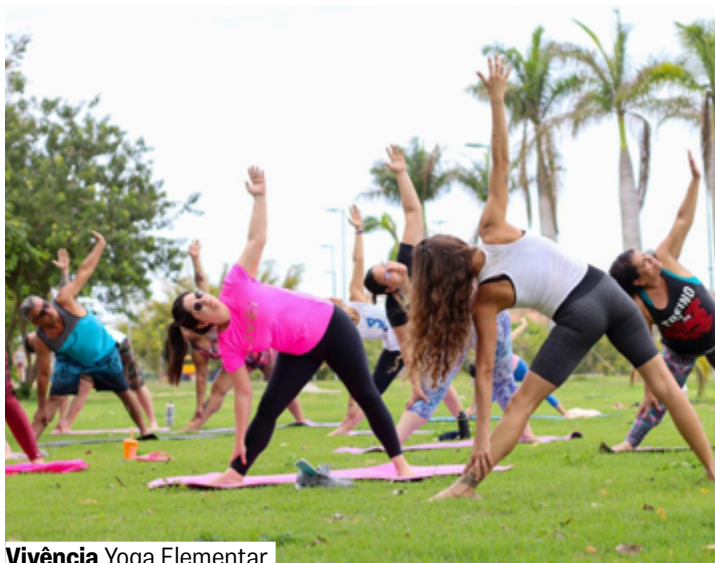
Vivência Yoga Elementar