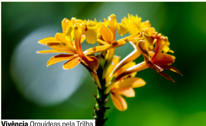
Vivência Orquídeas pela Trilha