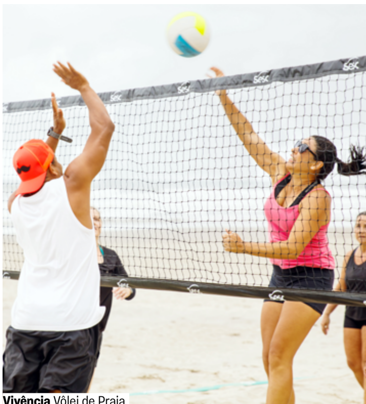
Vivência Vôlei de Praia