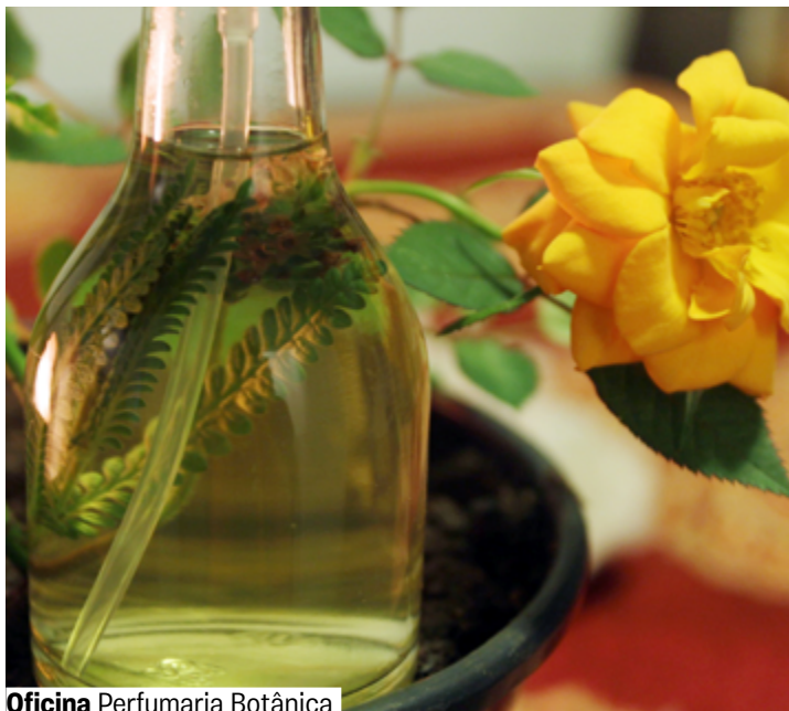
Oficina Perfumaria Botânica