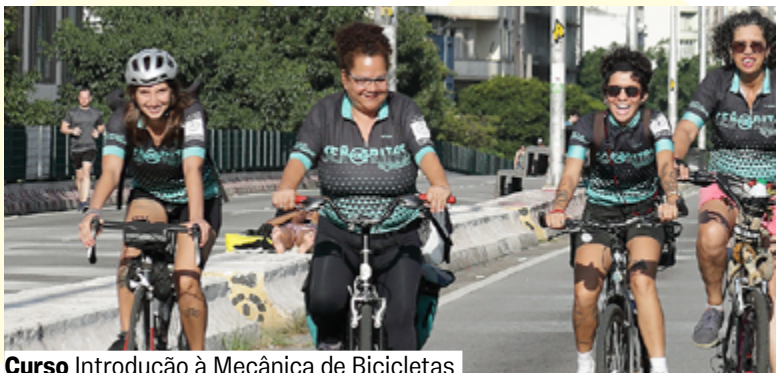
Curso Introdução à Mecânica de Bicicletas