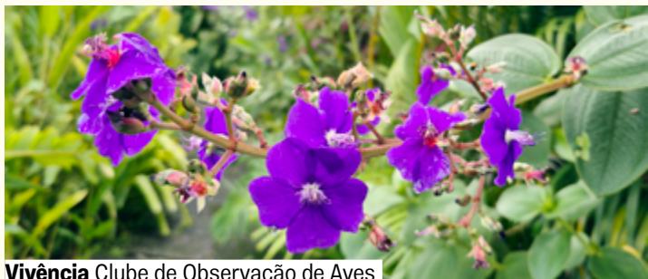
Vivência Clube de Observação de Aves