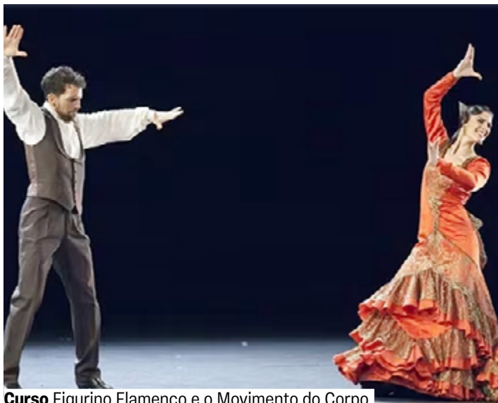
Curso Figurino Flamenco e o Movimento do Corpo