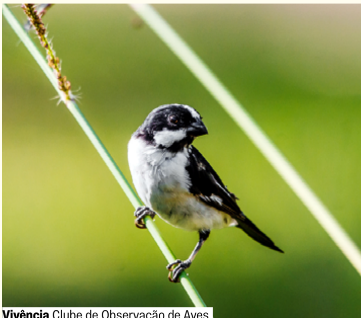
Vivência Clube de Observação de Aves