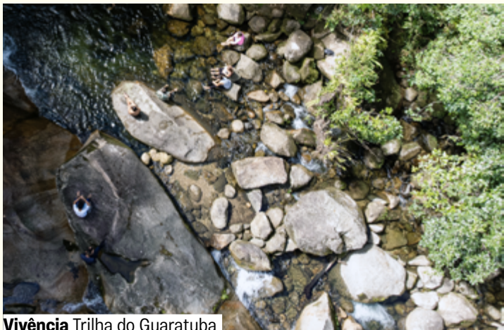
Vivência Trilha do Guaratuba