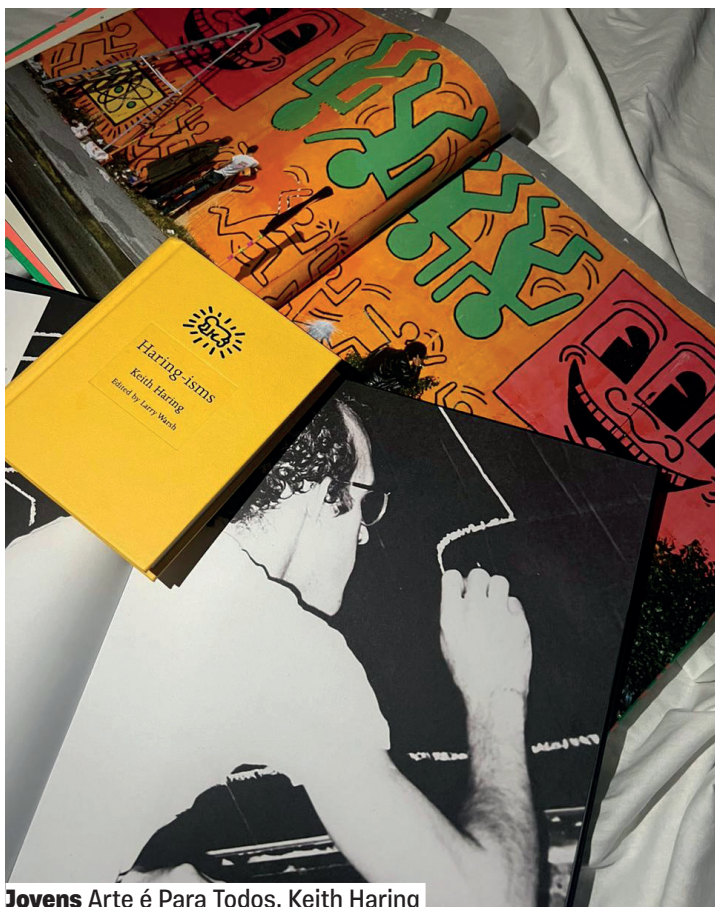
Jovens Arte é Para Todos, Keith Haring