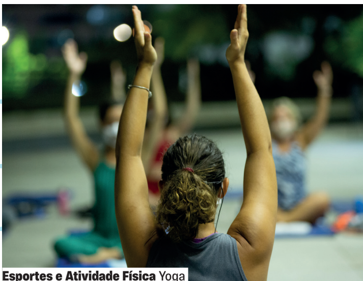
Esportes e Atividade Física Yoga