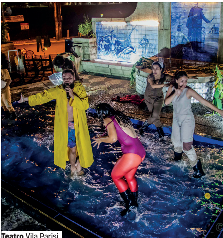
Teatro Vila Parisi