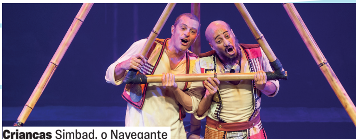
Crianças Simbad, o Navegante

De 12 a 15/10. Quinta a domingo, 12h às 17h. Convivência Grátis. De 0 a 6 anos