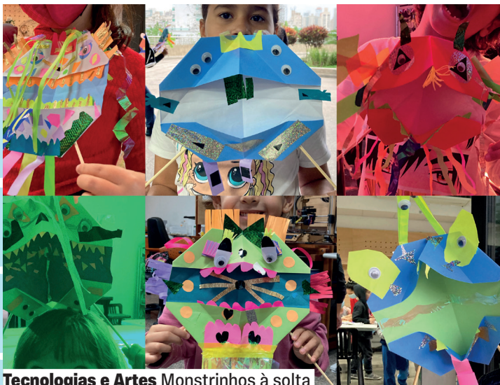
Tecnologias e Artes Monstrinhos à solta