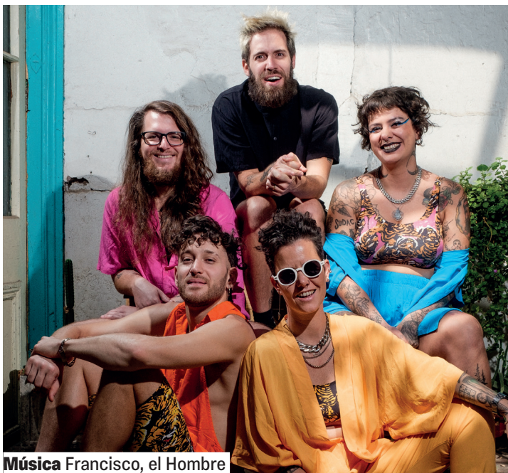
Música Francisco, el Hombre