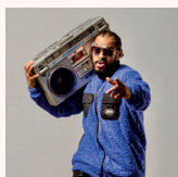
Thaíde - 40 anos de Hip Hop