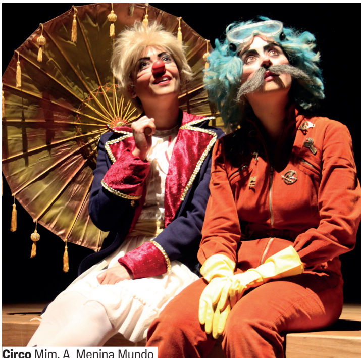
Circo Mim, A Menina Mundo