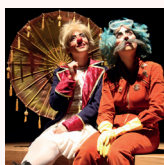
Mim, A Menina Mundo