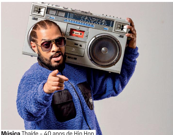
Música Thaíde - 40 anos de Hip Hop