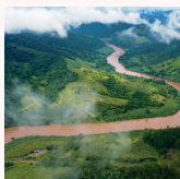
Nas Beiras do Ribeira