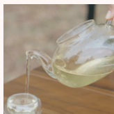
O Espírito do Chá