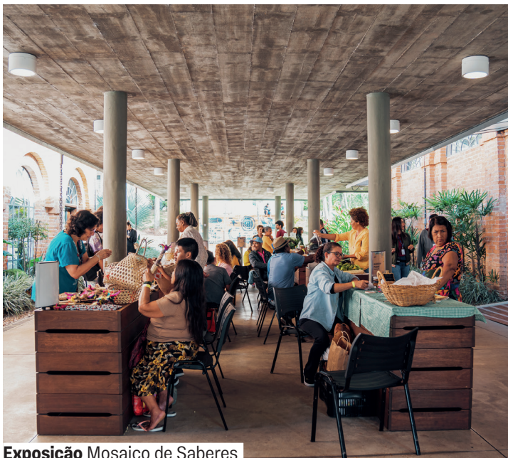
Exposição Mosaico de Saberes