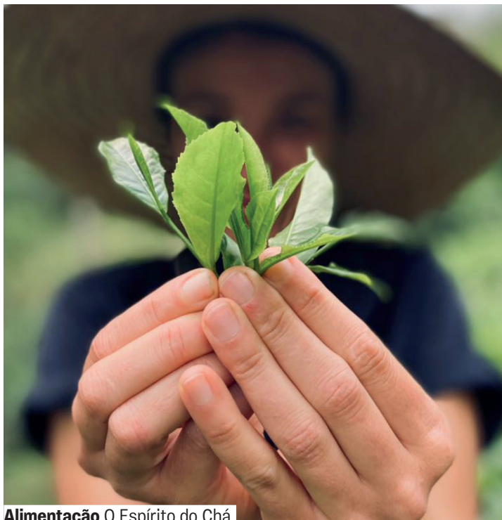
Alimentação O Espírito do Chá