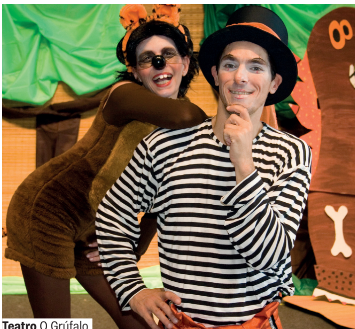
Teatro O Grúfalo