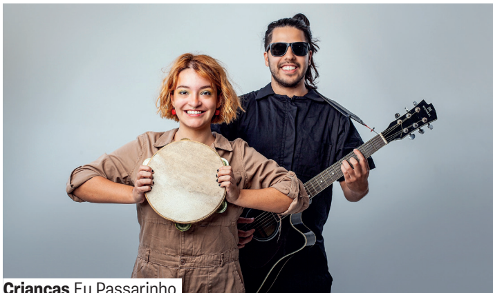
Crianças Eu Passarinho