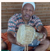
Tambor de Purunga