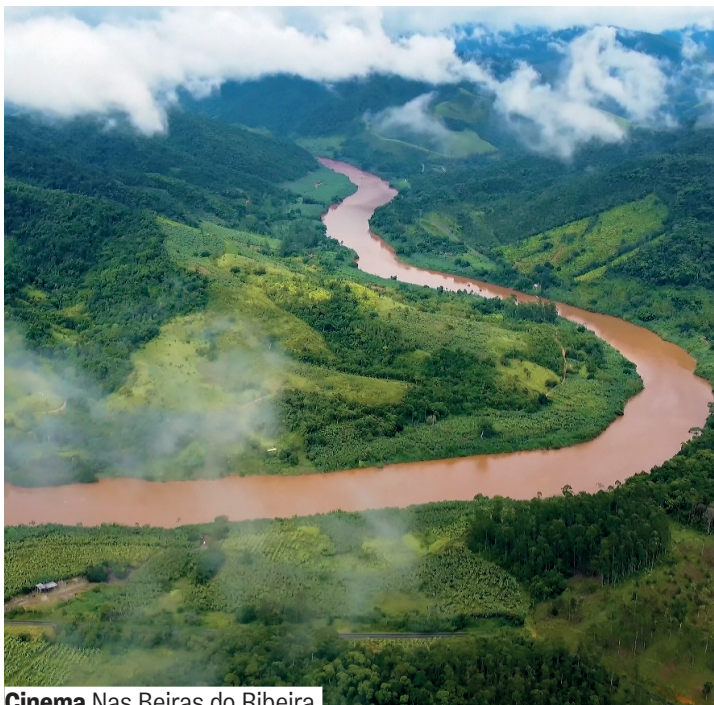
Cinema Nas Beiras do Ribeira