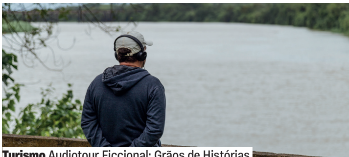
Turismo Audiotour Ficcional: Grãos de Histórias

Atividade gratuita e sem agendamento ou retirada de ingressos, mas é necessário retirada de equipamento na Central de Atendimento, mediante apresentação de documento com foto. 12