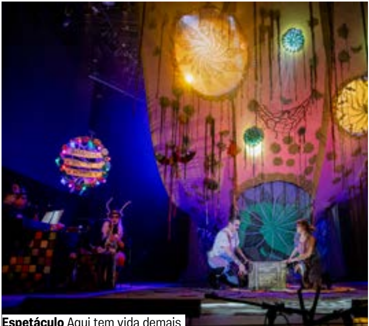
Espectáculo Aqui tem vida demais