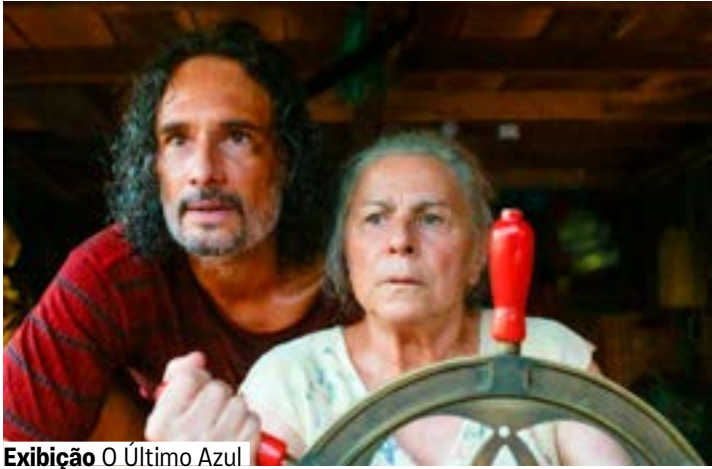
Exibição O Último Azul