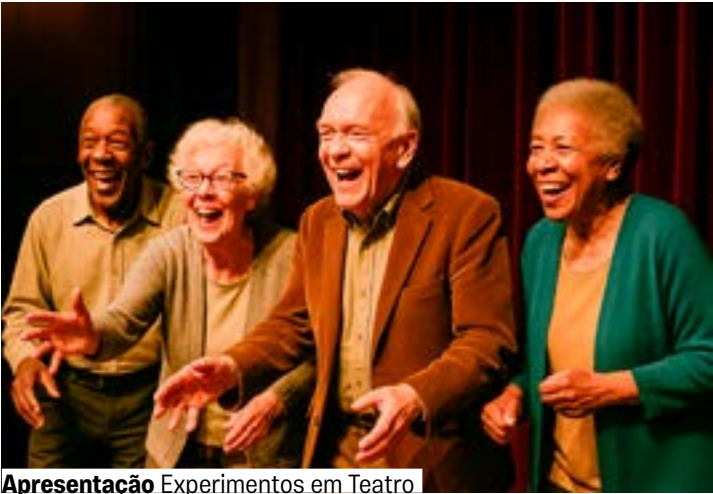
Apresentação Experimentos em Teatro