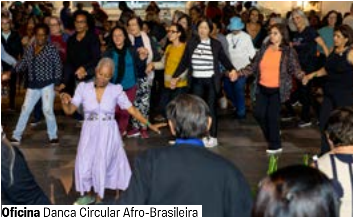
Oficina Dança Circular Afro-Brasileira