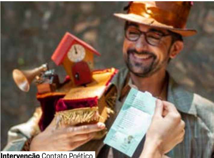
Intervenção Contato Poético