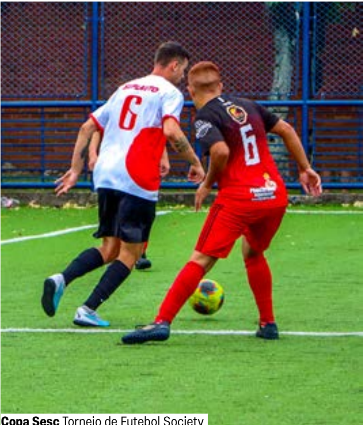
Copa Sesc Torneio de Futebol Society