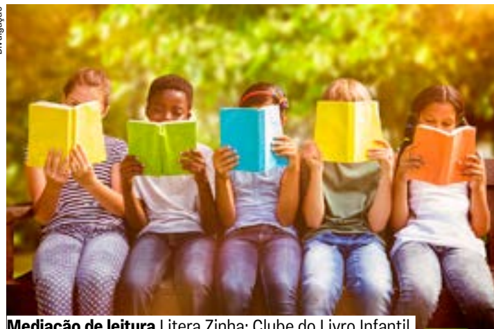
Mediação de leitura Litera Zinha: Clube do Livro Infantil