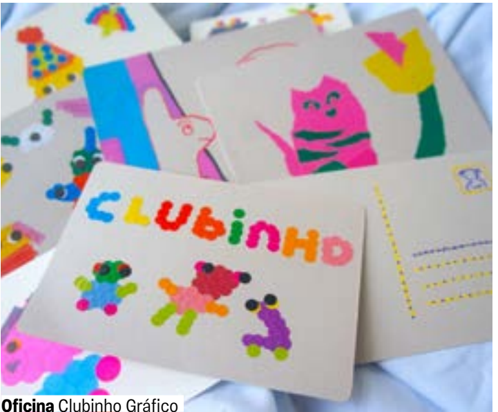
Oficina Clubinho Gráfico

O laboratório de experimentações visuais convida o público a explorar técnicas e formatos de criação gráfica a partir de sentimentos e percepções pessoais. A proposta estimula a autonomia criativa e o compartilhamento de ideias. Durante os encontros, os participantes terão contato com processos de produção e transformam seus desenhos autorais em bottons, postais, adesivos, zines e outras peças.