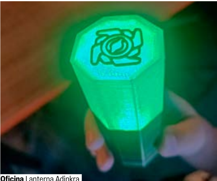
Oficina Lanterna Adinkra

Dias 6 e 7, sábado e domingo, 10h30 às 13h30 Espaço de Tecnologias e Artes. Grátis. Vagas limitadas. Inscrição no local. A partir de 10 anos