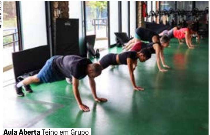
Aula Aberta Teino em Grupo