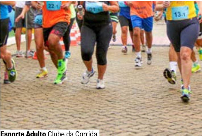
Esporte Adulto Clube da Corrida

Terças e quintas, 7h às 8h30 e 19h às 20h30. Até 18/12. Retorno em 6/1/26 Ginásio. Grátis. A partir de 16 anos