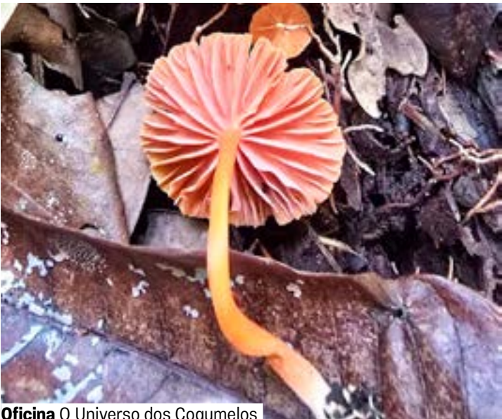
Oficina O Universo dos Cogumelos

Viveiro. Grátis. Vagas limitadas. Inscrições 30 min antes no local. A partir de 14 anos