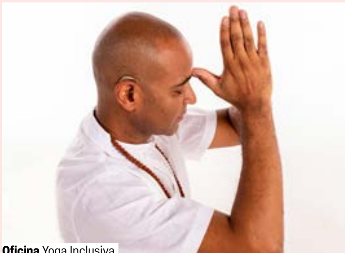
Oficina Yoga Inclusiva