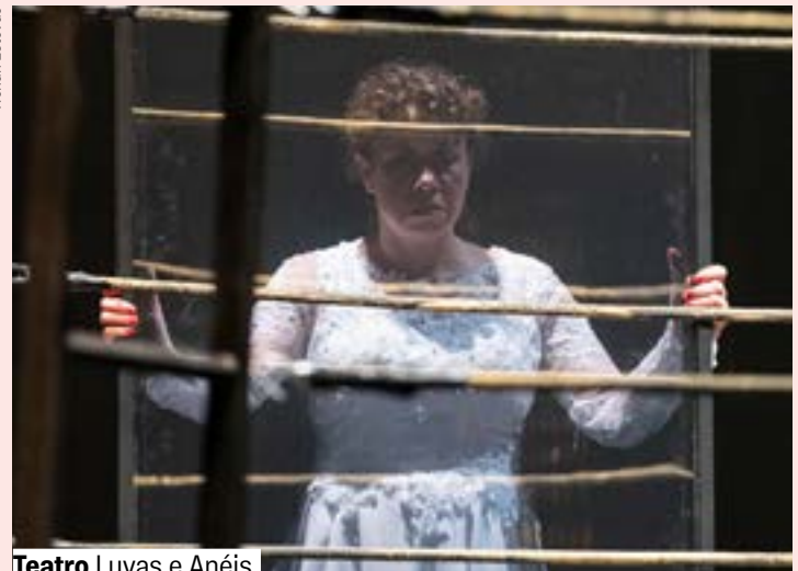
Teatro Luvas e Anéis