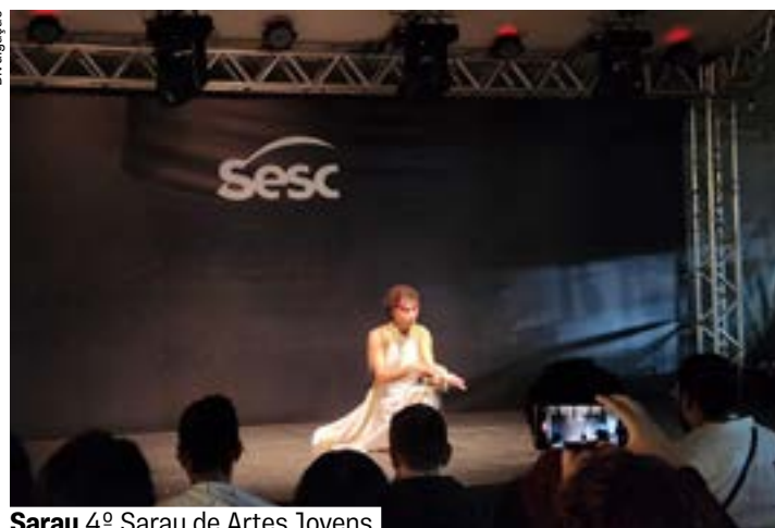
Sarau 4º Sarau de Artes Jovens