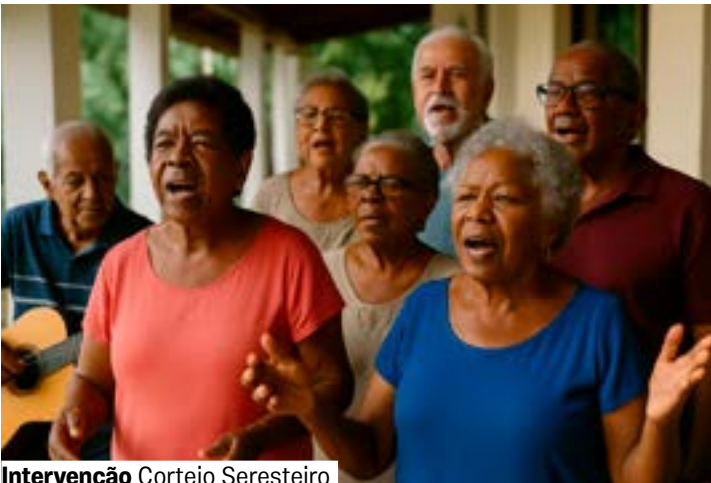
Intervenção Cortejo Seresteiro

Teatro (dia 2) e Marquise (dia 6). Sem retirada de ingressos. A partir de 60 anos