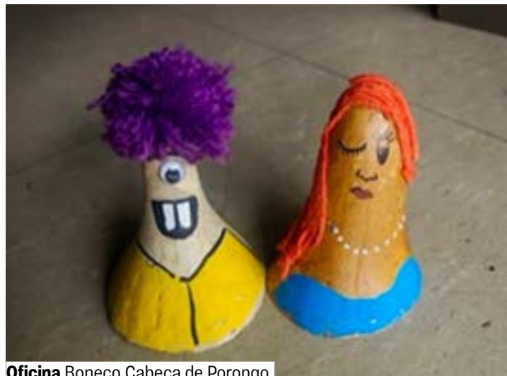
Oficina Boneco Cabeça de Porongo

Espaço Curumim / Juventudes. Grátis. Vagas limitadas. Inscrições 30 min antes no local. De 13 a 29 anos