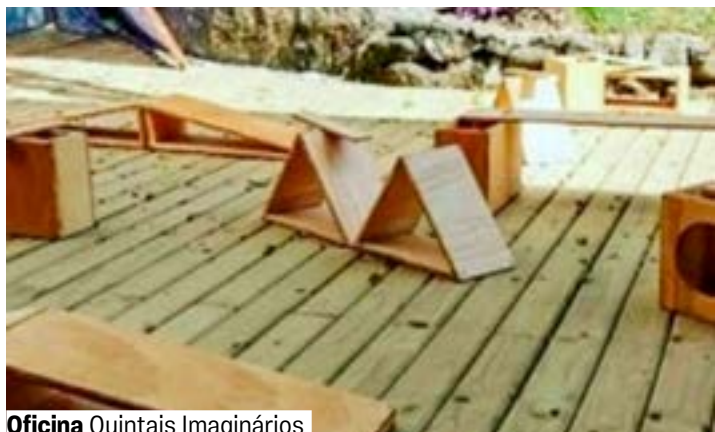
Oficina Quintais Imaginários