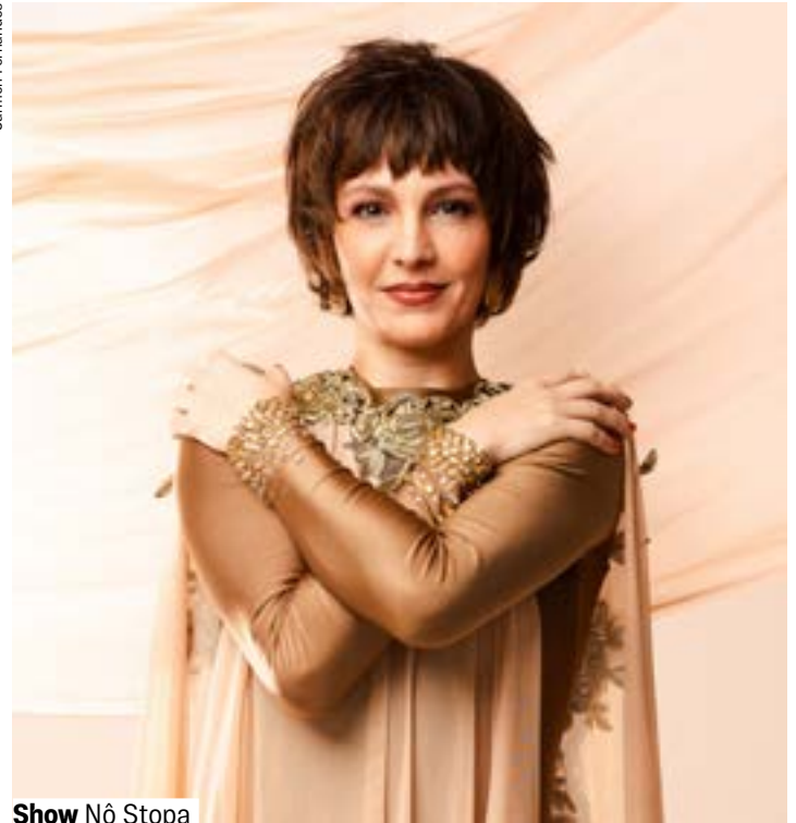
Show Nô Stopa