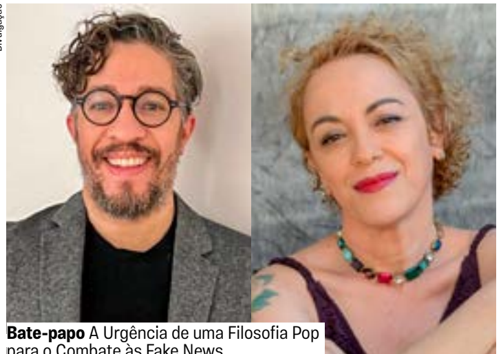
Bate-papo A Urgência de uma Filosofia Pop para o Combate às Fake News