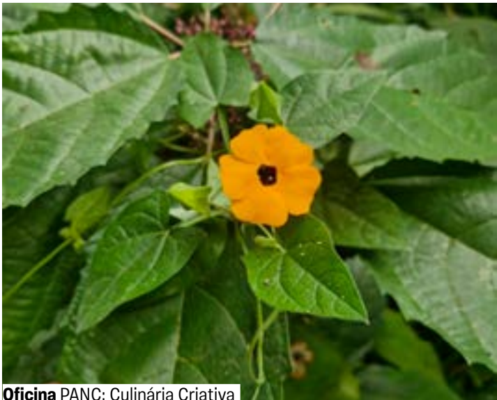
Oficina PANC: Culinária Criativa