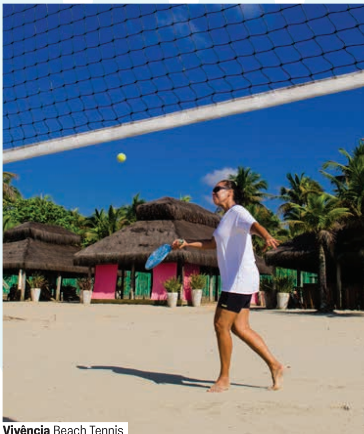
Vivência Beach Tennis