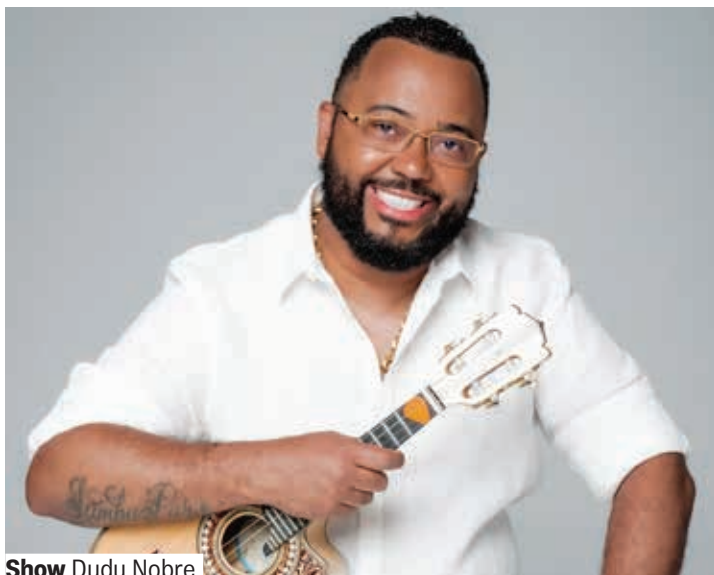
Show Dudu Nobre