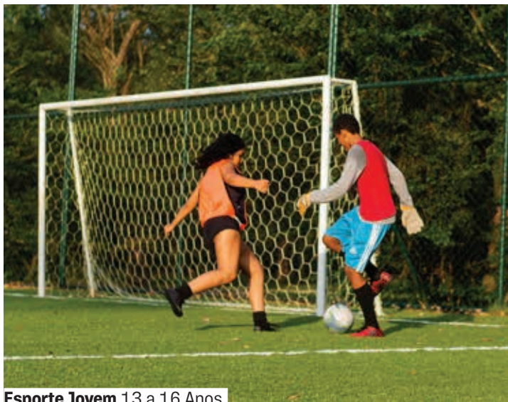
Esporte Jovem 13 a 16 Anos