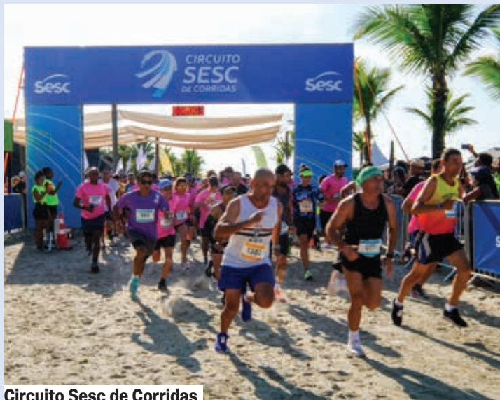
Circuito Sesc de Corridas