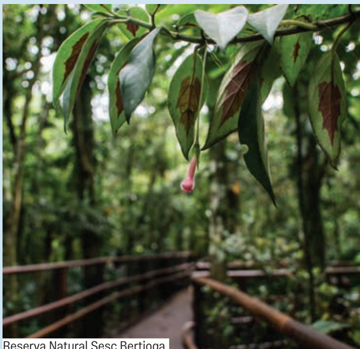
Reserva Natural Sesc Bertioga

Localizada a 700 metros da entrada do Centro de Férias, a Reserva é um espaço ao ar livre que protege uma área de mais de 600 mil metros quadrados de floresta de Mata Atlântica, dentro da cidade de Bertioga. Com recursos de acessibilidade, proporciona a todos e todas encontros com a natureza e suas relações. Você pode conhecer e aproveitar os espaços como o Jardim das Brincadeiras e a Trilha do Sentir, ouvir o som dos pássaros e outros animais, sentir o vento ou simplesmente relaxar. É aconselhável vestir roupas leves, tênis e boné. Levar repelente, protetor solar e garrafinha de água. Menores de idade devem estar sempre acompanhados por um responsável.