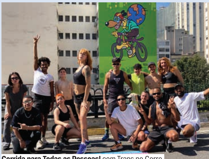
Corrida para Todas as Pessoas! com Trans no Corre