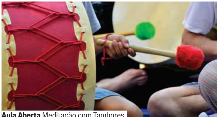
Aula Aberta Meditação com Tambores