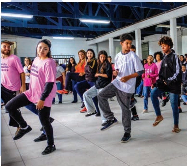
Dia do Desafio

Na Reserva Natural, diversas programações, que propõe a reflexão sobre questões relacionadas ao meio ambiente, para toda família. Um destaque para a Troca de Mudanças e Sementes, uma vivência para amantes de plantas, que desejam trocar ou compartilhar mudas e sementes que brotaram com facilidade em um canteiro ou vaso da sua casa.