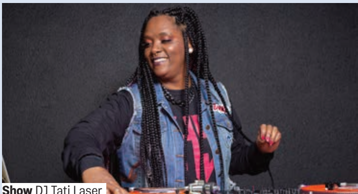
Estúdio Sara Rodrigues