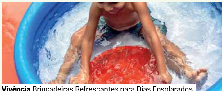
Vivência Brincadeiras Refrescantes para Dias Ensolarados

Para acessar as piscinas, é necessário possuir credencial e exame dermatológico válidos, assim como os trajes de banho adequados.