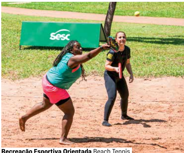
Recreação Esportiva Orientada Beach Tennis

*O local e os horários podem sofrer pequenos ajustes conforme a realização de atividades programáticas no mesmo espaço.