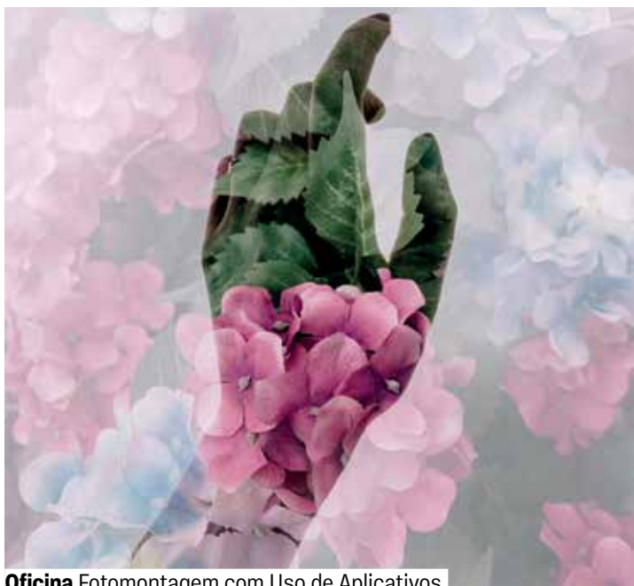
Oficina Fotomontagem com Uso de Aplicativos

Inscrições a partir das 14h do dia 7, por meio do app Credencial Sesc SP, do site sescsp.org.br/prudente ou na Central de Relacionamento (mediante agendamento).