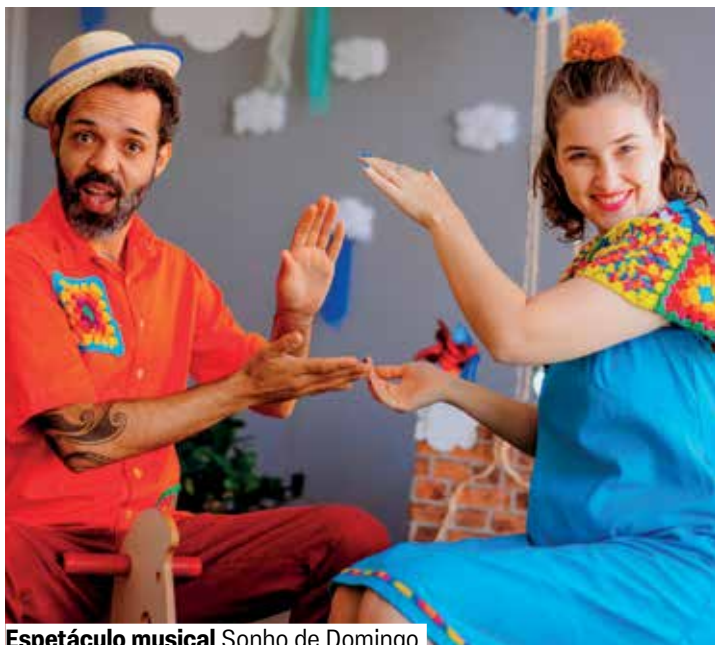
Espectáculo musical Sonho de Domingo