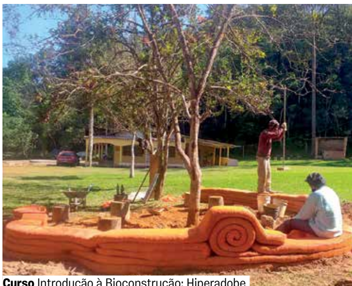
Curso Introdução à Bioconstrução: Hiperadobe

Inscrições a partir das 14h de 20/5, por meio do app Credencial Sesc SP, do site sescsp.org.br/prudente ou na Central de Relacionamento (mediante agendamento).