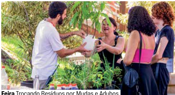
Feira Trocando Resíduos por Mudas e Adubos