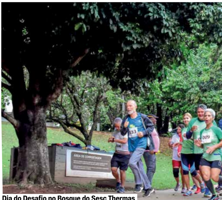
Dia do Desafio no Bosque do Sesc Thermas

Diversas vivências como a GPT - Ginástica para Todos; o Futmesa e o Airbadminton marcam presença e compõem a programação da nossa Unidade neste dia. Além disso, um desafio com bicicletas indoor também agita e fomenta a prática de atividades físicas no Sesc Thermas.