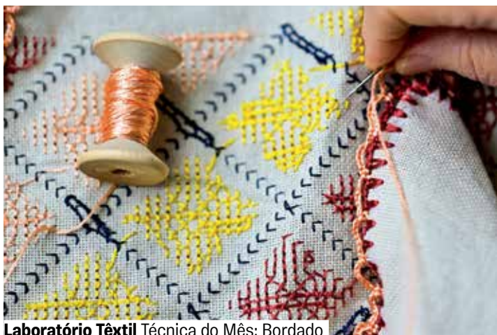
Laboratório Têxtil Técnica do Mês: Bordado

Entrega de senhas no local, mediante à capac. do espaço.