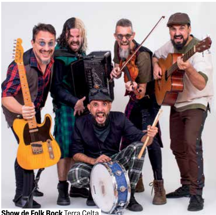
Show de Folk Rock Terra Celta