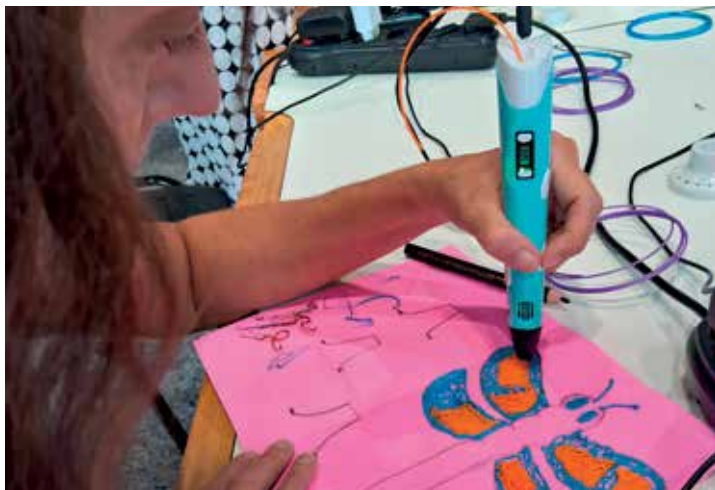
Oficina Laboratório de Traquitanas, Engenhocas e outros Inventos

Menores de 10 anos devem estar acompanhados pelos seus responsáveis. Entrega de senhas no local com 30 minutos de antecedência.