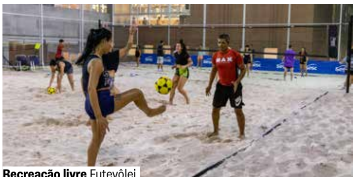
Recreação livre Futevôlei

17h15 às 18h30. Exceto dias 17, 23, 24 e 31.