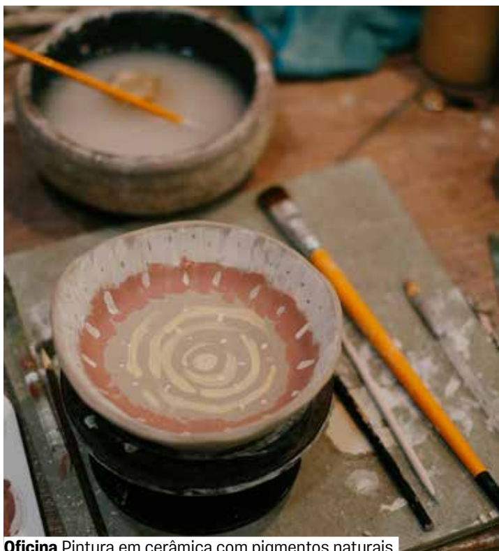
Oficina Pintura em cerâmica com pigmentos naturais

Sala de Oficinas. Vagas limitadas. Grátis. Retirada de senhas 30 minutos antes. De 7 a 12 anos.