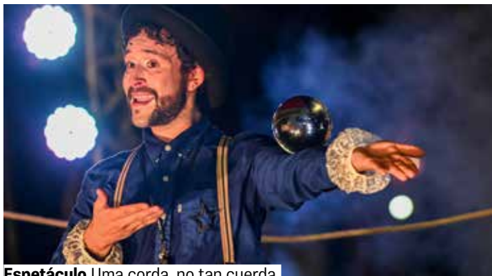
Espetáculo Uma corda, no tan cuerda