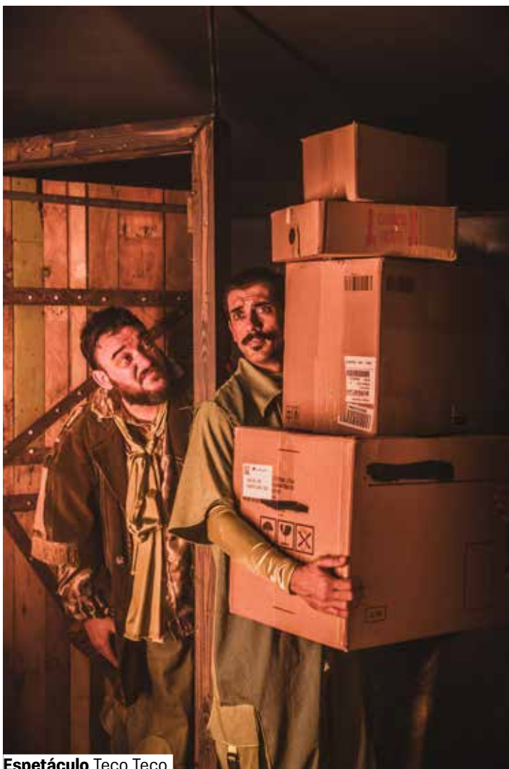
Espetáculo Teco Teco