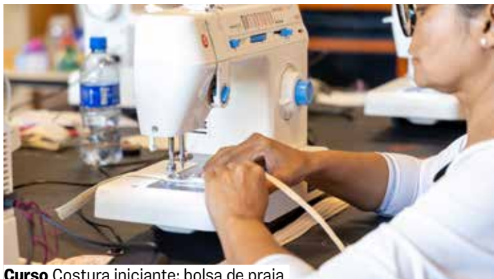
Curso Costura iniciante: bolsa de praia

Espaço de Tecnologias e Artes. Vagas limitadas. Grátis. Retirada de senhas 1 hora antes. A partir de 16 anos.