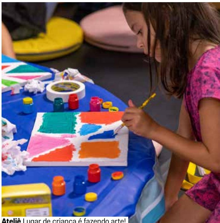
Ateliê Lugar de criança é fazendo arte!

Espaço de Brincar. Vagas limitadas. Grátis. Retirada de senhas 1 hora antes. De 3 a 6 anos.