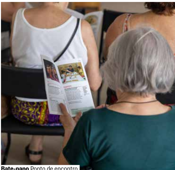
Bate-papo Ponto de encontro

Sala 1. Vagas limitadas. Grátis. Retirada de senhas 1 hora antes. A partir de 60 anos.