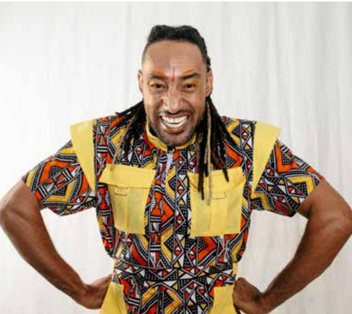
Espetáculo Zuri e a Iroko - Através do tempo-espaço