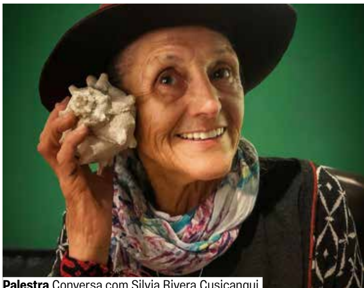
Palestra Conversa com Silvia Rivera Cusicanqui

Anfiteatro. Lugares limitados. Grátis. Retirada de ingressos 1 hora antes. Todas as idades.