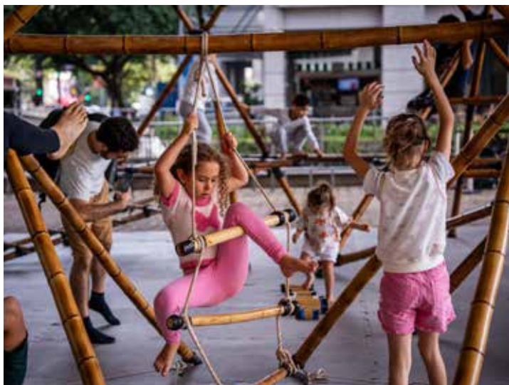
Vivência LUDUS - Espaço Pirambô de jogos e atividades de lazer

Dias 2, 16 e 30 | Espaço de Exposições Dia 9 | Sala de Práticas Corporais | Retirada de senhas 30 minutos antes. Dia 23 | Solário da Piscina Vagas limitadas. Grátis. A partir de 12 anos.