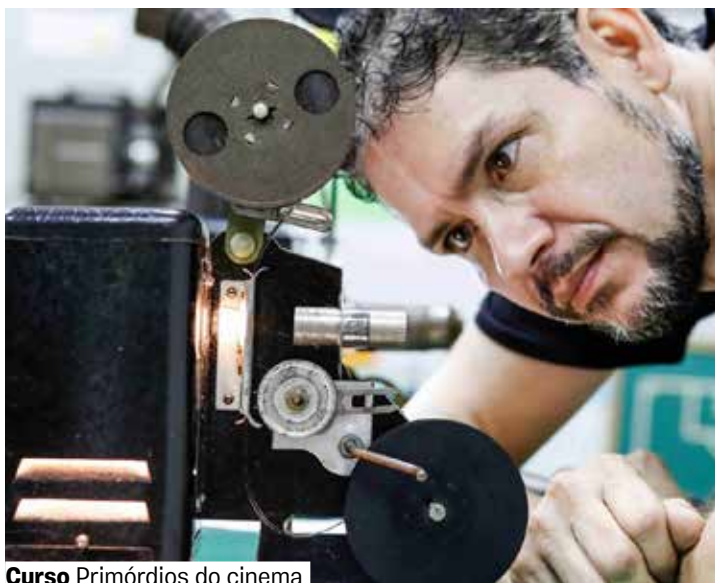
Curso Primórdios do cinema

Para o público geral, retirada de ingressos 30 minutos antes. Todas as idades.