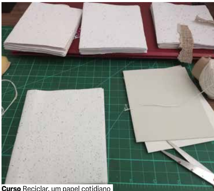
Curso Reciclar, um papel cotidiano

Sala 1. Vagas limitadas. Grátis. Retirada de senhas 1 hora antes. A partir de 12 anos.