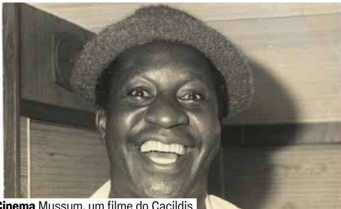
Cinema Mussum, um filme do Cacildis