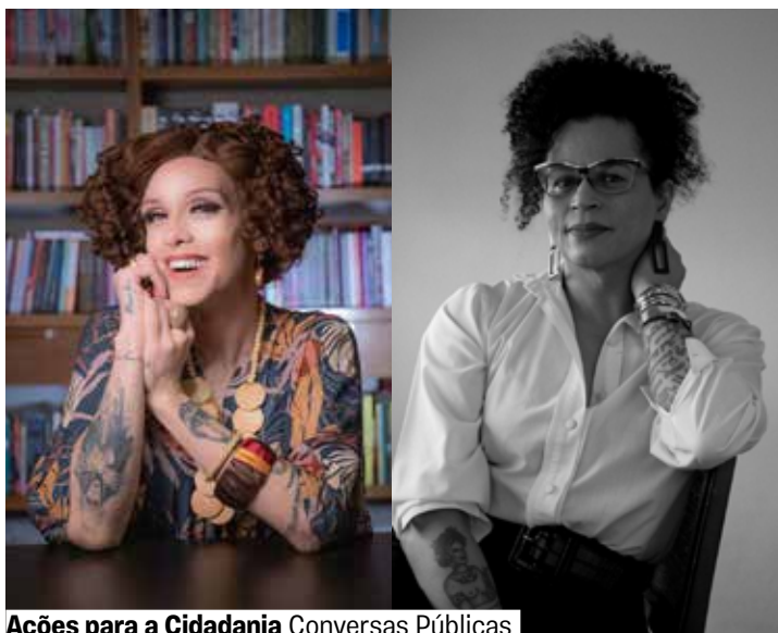
Ações para a Cidadania Conversas Públicas