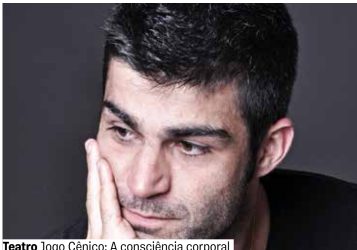
Teatro Jogo Cênico: A consciência corporal

Inscrições on-line a partir de 3/9, às 18h. A partir de 16 anos.