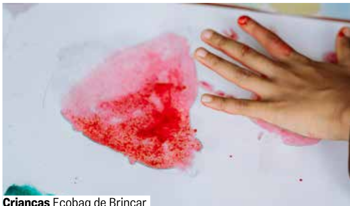
Crianças Ecobag de Brincar