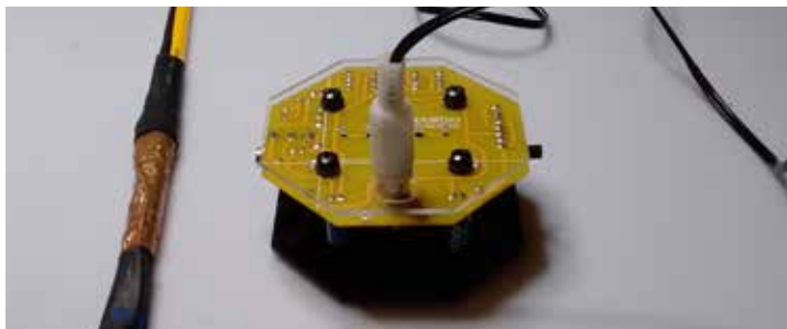
Tecnologias e Artes Pincéis Sonoros - Drawdio

Inscrições on-line a partir de 24/9, às 18h. A partir de 16 anos.