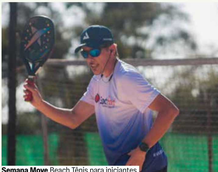
Semana Move Beach Tênis para iniciantes