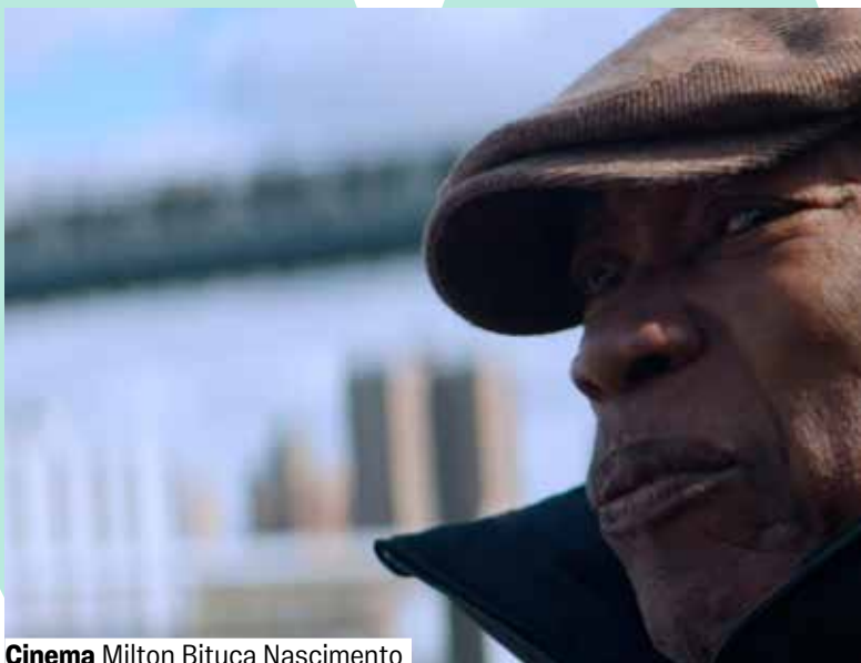
Cinema Milton Bituca Nascimento