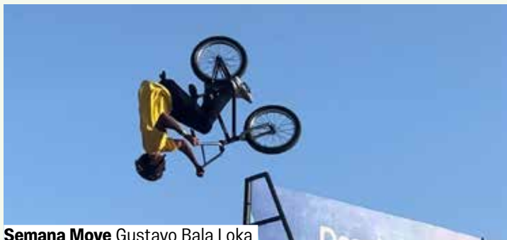
Semana Move Gustavo Bala Loka