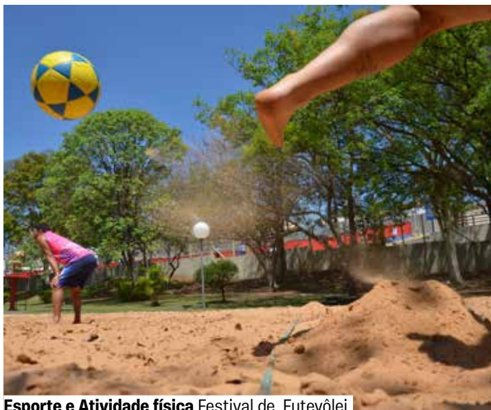
Esporte e Atividade física Festival de Futevôlei

Dia 28/9. Domingo, 10h30. Quadra de areia. Grátis. Inscrições no local. A partir de 12 anos.