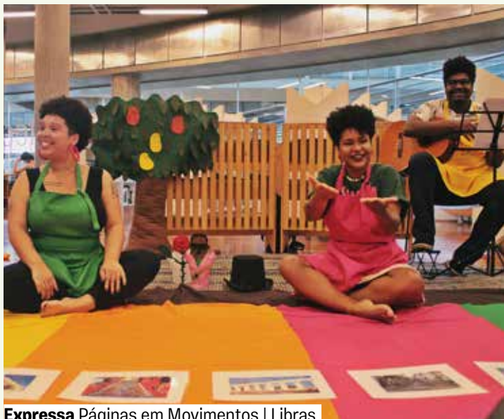
Expressa Páginas em Movimentos | Libras