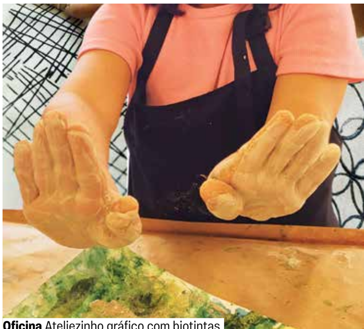
Oficina Ateliezinho gráfico com biotintas

Espaço Tecnologias e Artes. Grátis. Senhas no local 30 minutos antes. Encontros independentes. A partir de 7 anos.