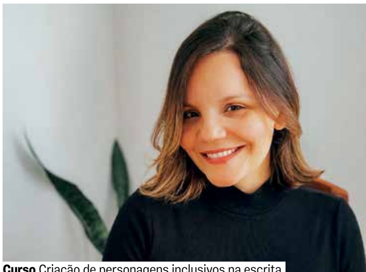
Curso Criação de personagens inclusivos na escrita