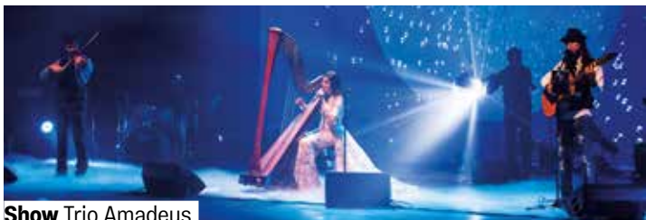
Show Trio Amadeus