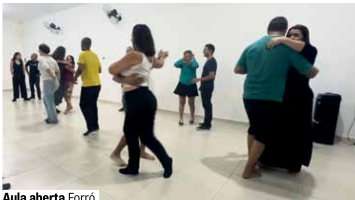
Aula aberta Forró

Espaço Corpo e Arte. Grátis. Vagas limitadas. Senhas no local 30 minutos antes. A partir de 12 anos.