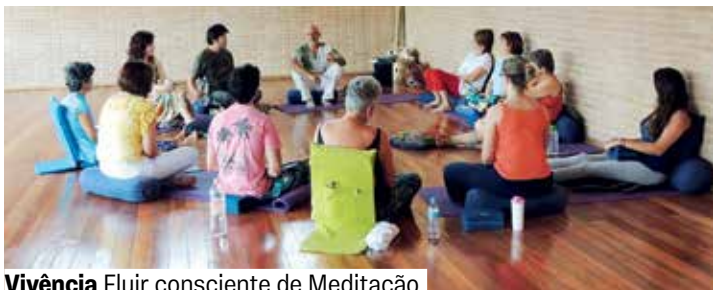
Vivência Fluir consciente de Meditação

Espaço Corpo e Arte. Grátis. Senhas no local 30 minutos antes. A partir de 60 anos.