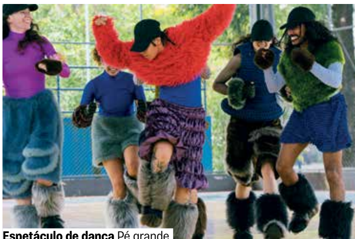
Espetáculo de dança Pé grande