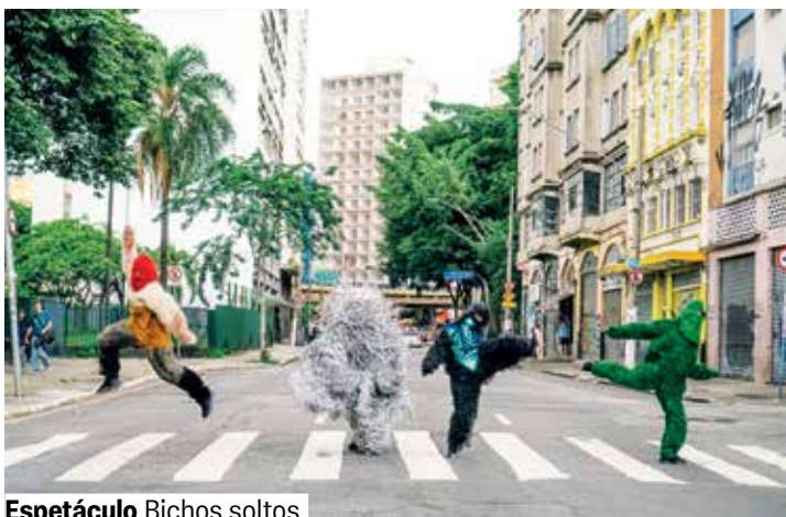
Espetáculo Bichos soltos