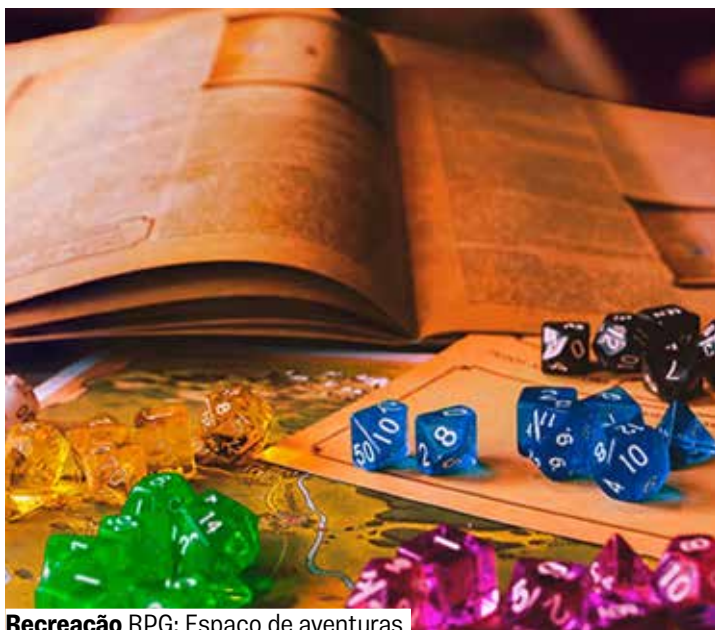
Recreação RPG: Espaço de aventuras

Espaço Corpo e Arte. Grátis. Vargas limitadas. A partir de 13 anos.