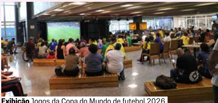
Exibição Jogos da Copa do Mundo de futebol 2026