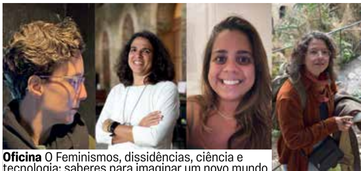
Oficina O Feminismos, dissidências, ciência e tecnologia: saberes para imaginar um novo mundo

Um momento para imaginar futuros possíveis e necessários para a ciência e a tecnologia. Para além das palavras, serão propostas outras formas de troca, de sentir e pensar que ajudem a escapar do que está posto como norma. Serão utilizadas formas diversas de manualidades, para expressar e dar forma ao que não podemos antecipar, ao imprevisto e ao imprevisível, que cada participante poderá trazer.