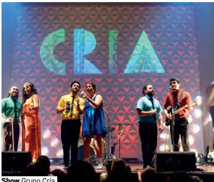
Show Grupo Cria