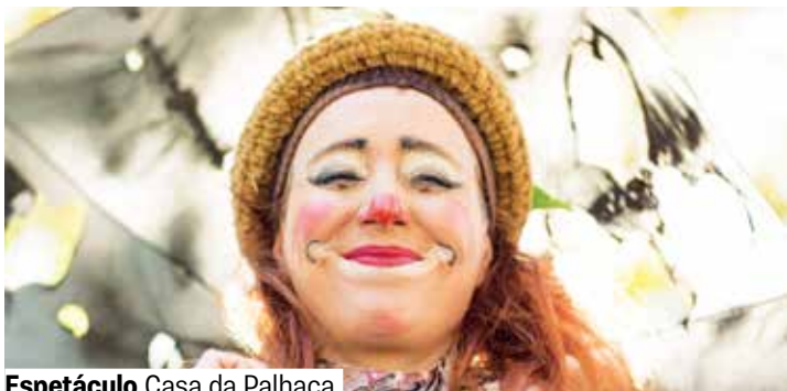
Espetáculo Casa da Palhaça