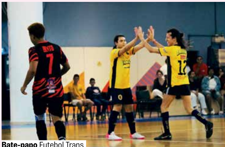
Bate-papo Futebol Trans