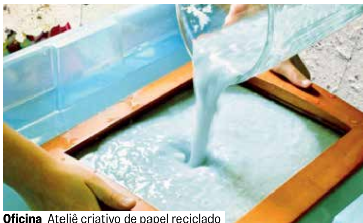
Oficina Ateliê criativo de papel reciclado

Oficina. Grátis. Senhas no local 30 minutos antes. Encontros independentes. A partir de 7 anos.