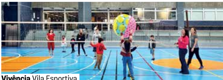
Vivência Vila Esportiva

Jogos, brincadeiras e atividades motoras praticadas de maneira lúdica, propiciando a experimentação e a participação integrada entre crianças e adultos. A cada final de semana uma proposta diferente, tendo como elementos básicos as habilidades motoras e as brincadeiras em família.