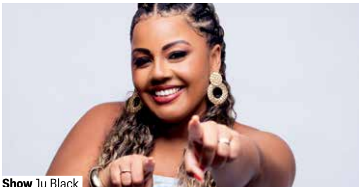
Show Ju Black