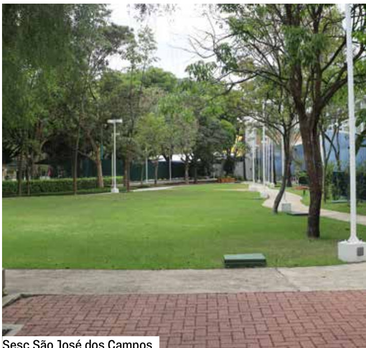
Sesc São José dos Campos

Diante das urgências ambientais e da busca por novos modos de viver e conviver, o “Festival Florestar – do quintal à floresta”, propõe experiências que conectam natureza, cultura e sociedade por meio de palestras, vivências, práticas artísticas e ações educativas. Em sua segunda edição, o projeto tem como tema as florestas urbanas, destacando as áreas verdes das cidades como espaços fundamentais de convivência, bem-estar, qualidade de vida e preservação ambiental. Entre os destaques estão o encontro com o pesquisador Jean Ometto, do Instituto Nacional de Pesquisas Espaciais (INPE), que apresenta como a ciência espacial se tornou uma aliada indispensável da preservação ambiental, e a presença do botânico italiano Stefano Mancuso, referência internacional nos estudos sobre a inteligência e o comportamento das plantas, ampliando o debate sobre biodiversidade, sustentabilidade e futuros possíveis.