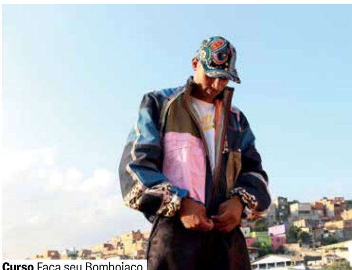
Curso Faça seu Bombojaco