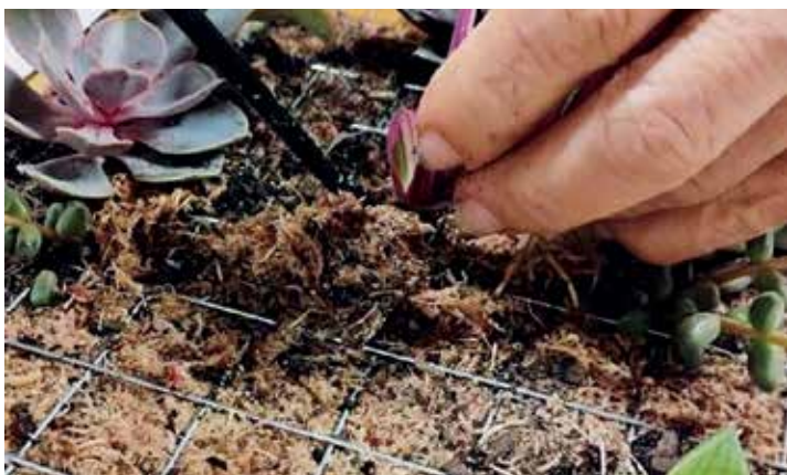
Oficina Quadros Vivos: O Jardim da Memória e o Florescer do Ikigai

Dia 18. Quinta. Das 9h às 12h e das 15h às 18h. Auditório. Grátis. Senhas no local 30 minutos antes. A partir de 60 anos.