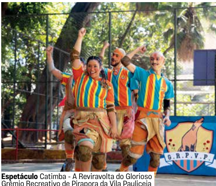
Espetáculo Catimba - A Reviravolta do Glorioso Grêmio Recreativo de Pirapora da Vila Pauliceia