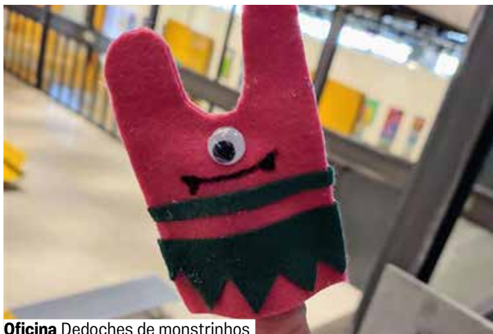
Oficina Dedoches de monstros

Grátis. Senhas 30 min. antes. A partir de 16 anos.