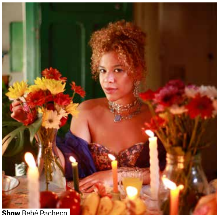
Show Bebê Pacheco