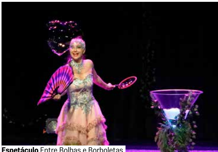
Espetáculo Entre Bolhas e Borboletas