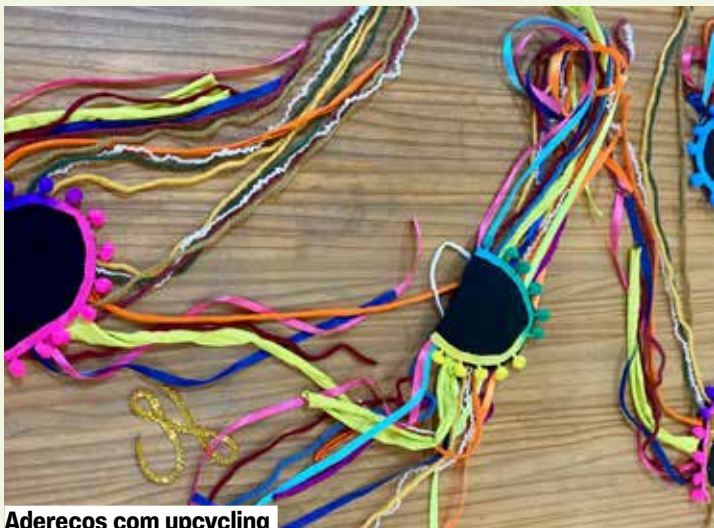
Adereços com upcycling