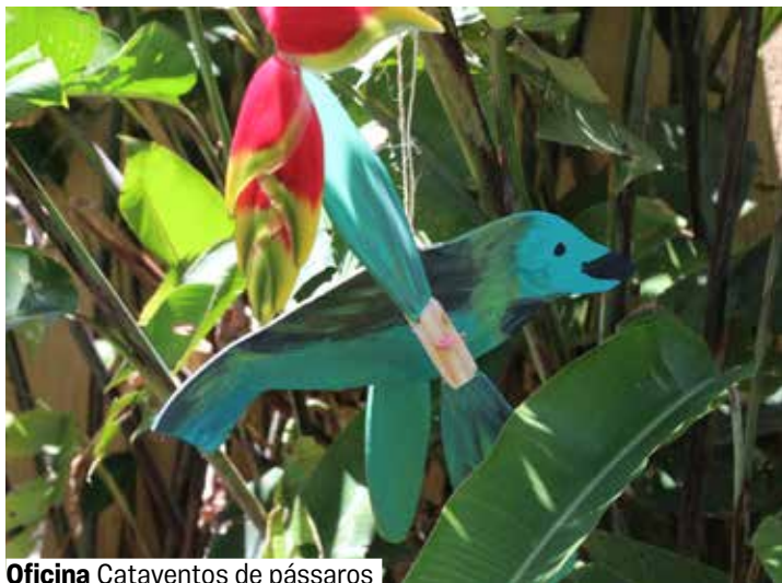
Oficina Cataventos de pássaros