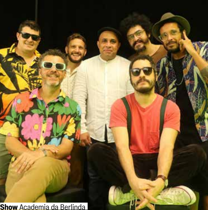
Show Academia da Berlinda