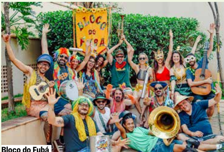
Bloco do Fubá

Sala 4. Grátis. Senhas 30 min. antes. 0 a 3 anos