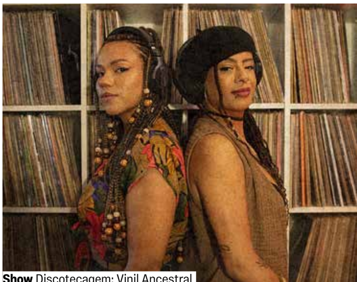
Show Discotecagem: Vinil Ancestral