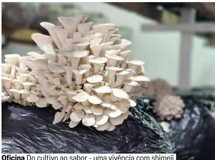
Oficina Do cultivo ao sabor - uma vivência com shimeji