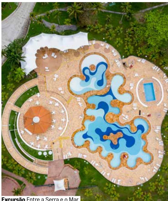
Excursão Entre a Serra e o Mar