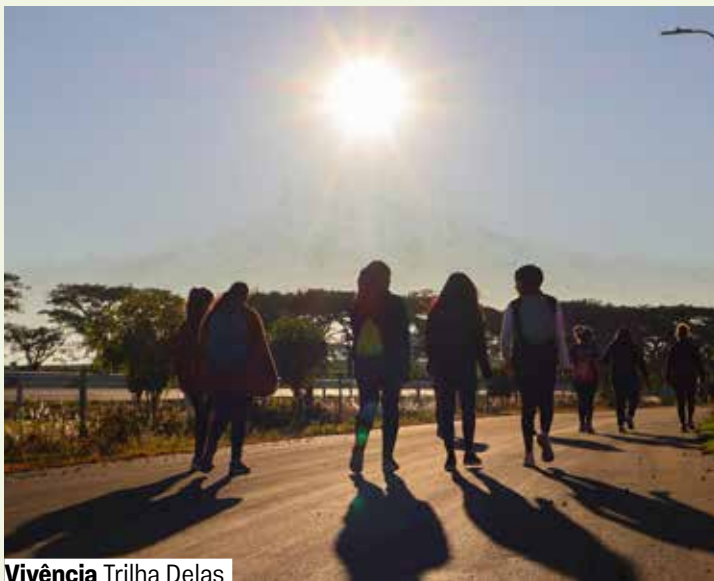
Vivência Trilha Delas

Espaço de Tecnologias e Artes. Grátis. Inscrições on-line a partir de 28/1, às 18h. A partir de 16 anos.