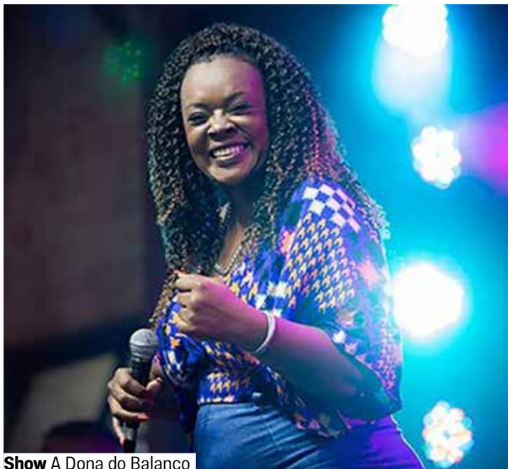
Show A Dona do Balanço