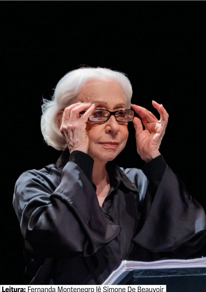
Leitura: Fernanda Montenegro lê Simone De Beauvoir