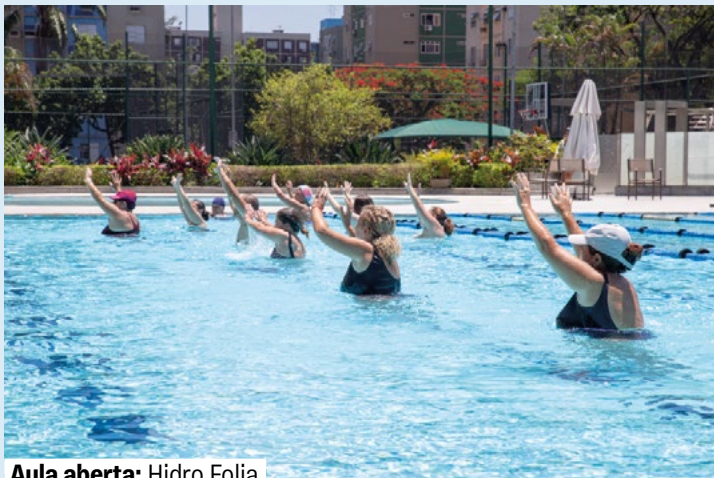
Aula aberta: Hidro Folia