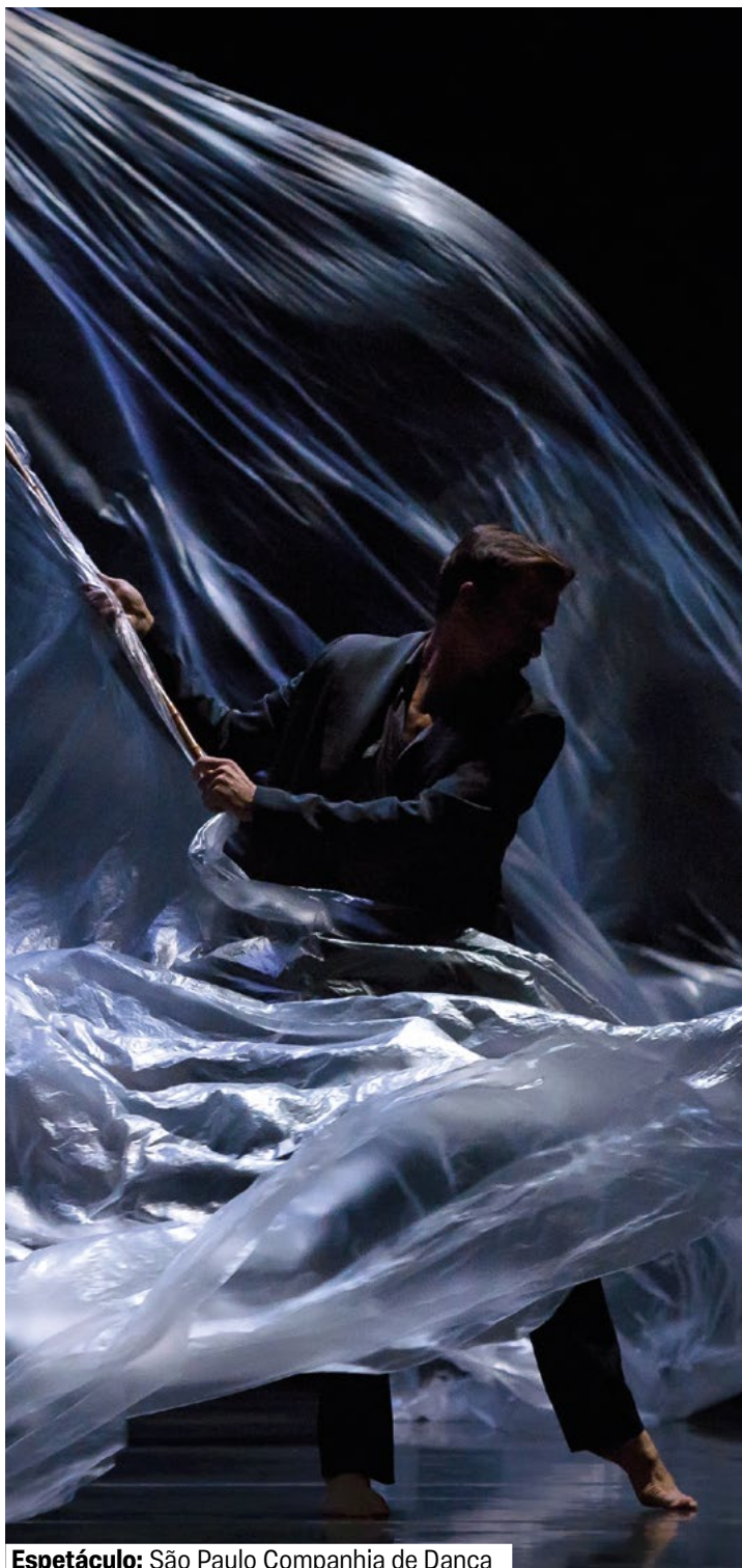
Espetáculo: São Paulo Companhia de Dança