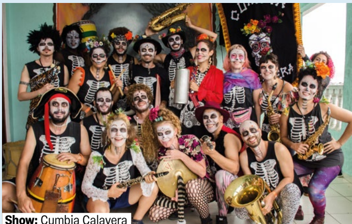
Show: Cumbia Calavera