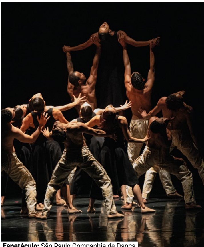
Espetáculo: São Paulo Companhia de Dança