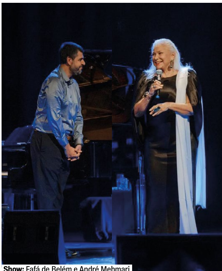
Show: Fafá de Belém e André Mehmari