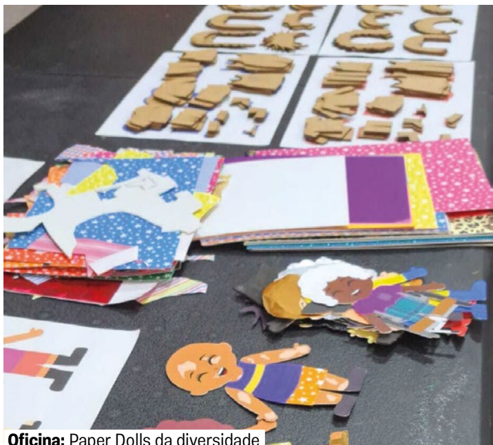
Oficina: Paper Dolls da diversidade