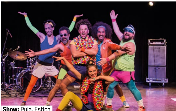
Show: Pula, Estica