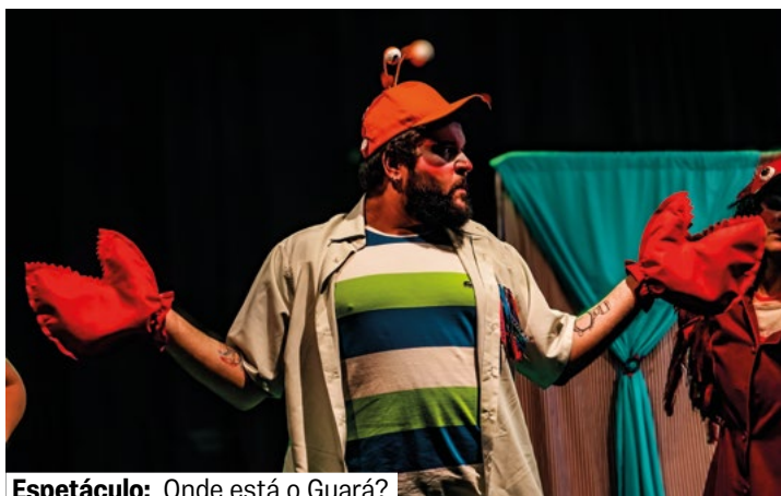
Espetáculo: Onde está o Guará?