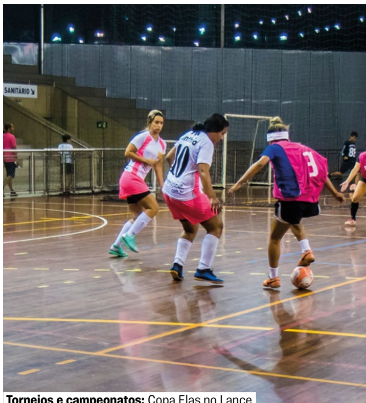
Torneios e campeonatos: Copa Elas no Lance