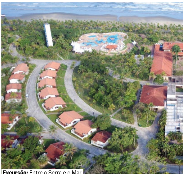
Excursão: Entre a Serra e o Mar