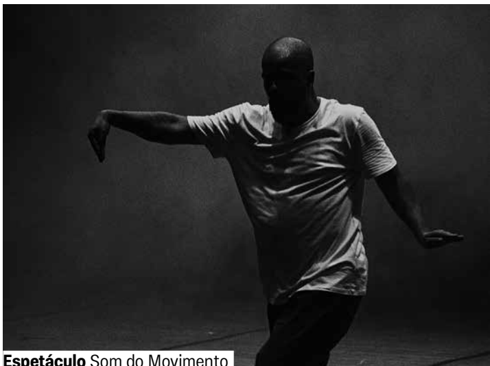
Espetáculo Som do Movimento