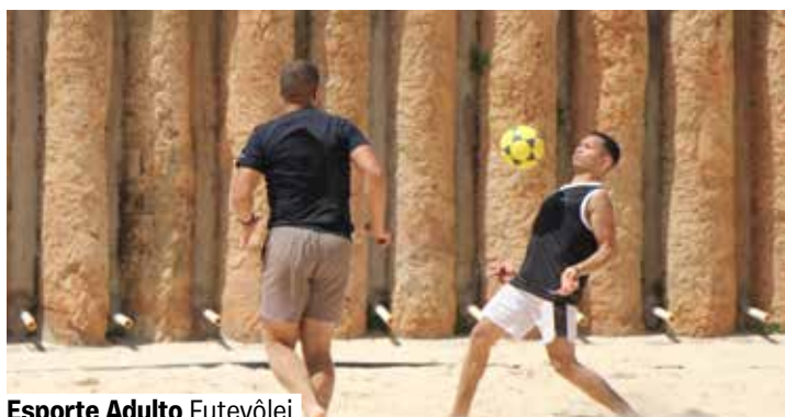
Esporte Adulto Futevôlei