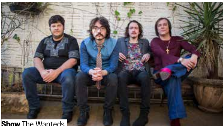
Show The Wanted's