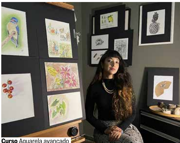
Curso Aquarela avançado