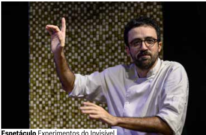
Espetáculo Experimentos do Invisível