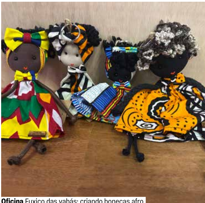
Oficina Fuxico das yabás: criando bonecas afro

Espaço de Tecnologias e Artes. Grátis Senhas 30 min. antes. A partir de 10 anos.