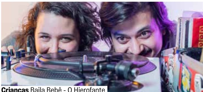
Crianças Baila Bebê - O Hierofante