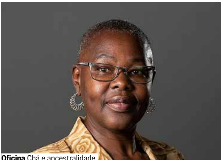
Oficina Chá e ancestralidade

Sala 4. Grátis. Senhas 30 min. antes. A partir de 18 anos.