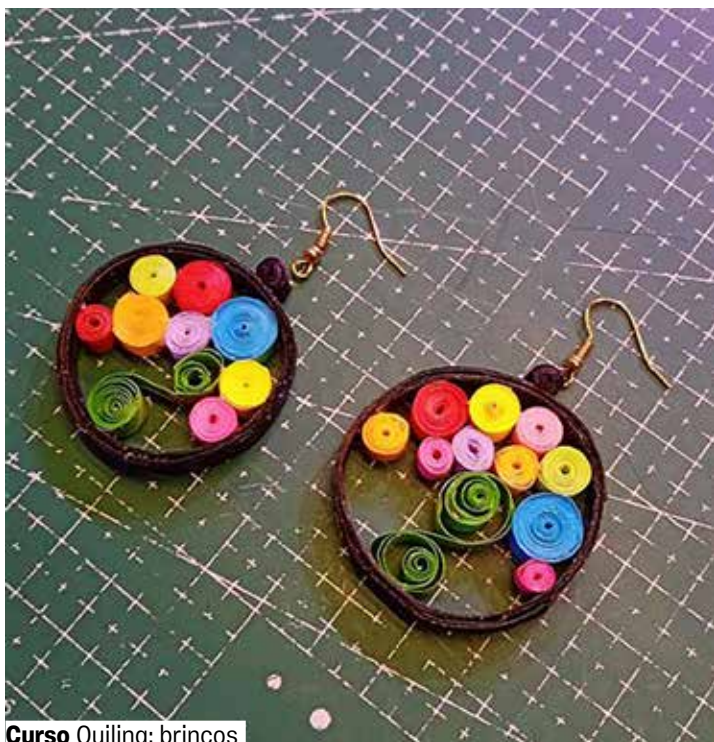
Curso Quiling: brincos

Grátis. Senhas 30 min. antes A partir de 12 anos.