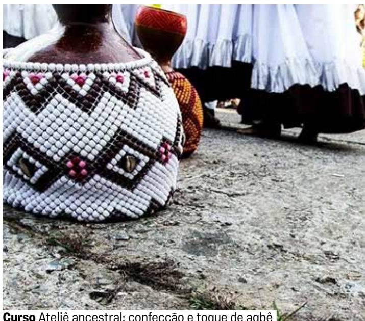
Curso Ateliê ancestral: confecção e toque de agbê

Inscrições on-line a partir de 25/3, às 18h. A partir de 16 anos.