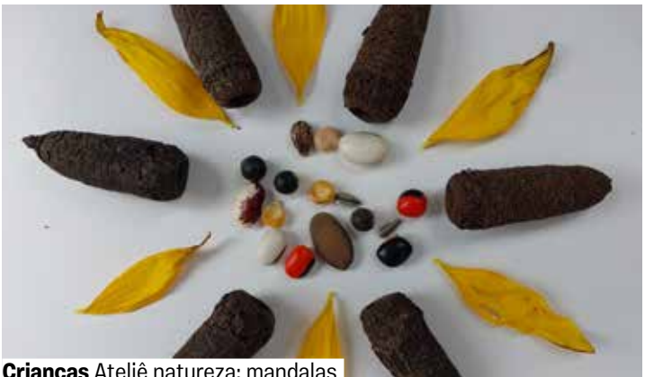
Crianças Ateliê natureza: mandalas

Varanda de Múltiplo Uso. Grátis. Senhas 30 min. antes. De 7 a 12 anos.