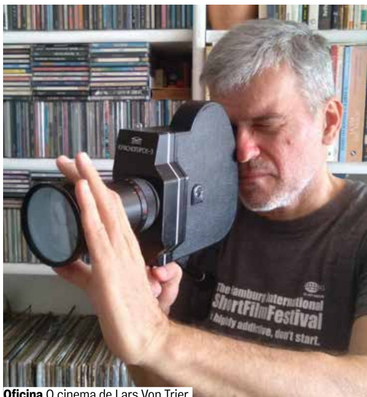
Oficina O cinema de Lars Von Trier

Sala 4. Grátis. Senhas 30 min. antes. A partir de 16 anos.