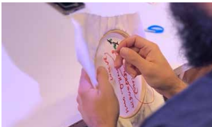
Oficina Clube do bordado: livro de pontos, primeiras páginas