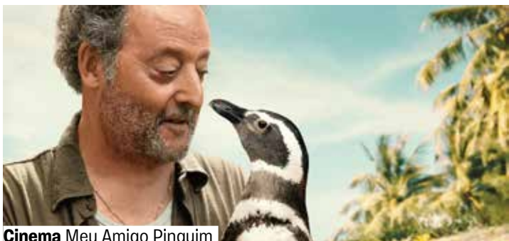
Cinema Meu Amigo Pinguim