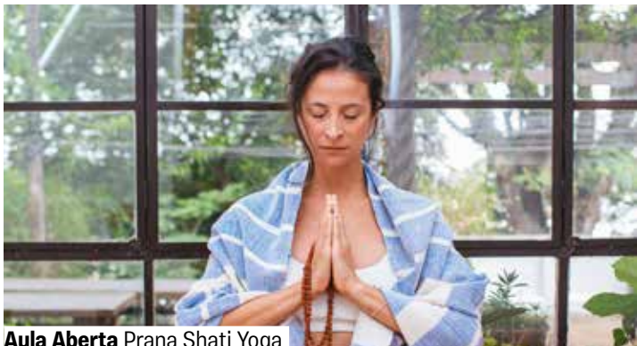
Aula Aberta Prana Shati Yoga