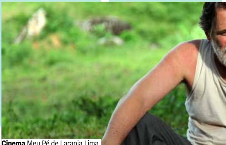
Cinema Meu Pé de Laranja Lima

O cinema traz histórias sobre vínculos e afeto. Meu Amigo Pinguim , WALL-E , Meu Pé de Laranja Lima e Hachiko - Para Sempre compõem uma programação que fala de amizade, lealdade e encontros improváveis, convidando o público a refletir sobre as relações que nos marcam.