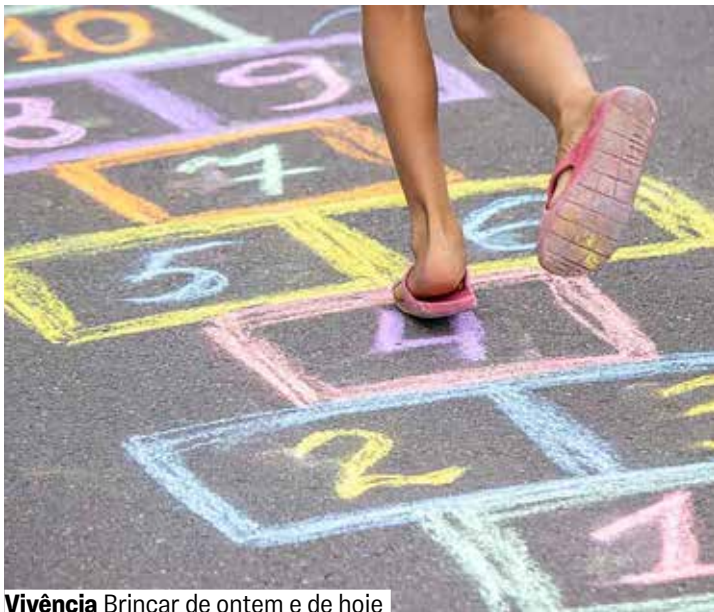
Vivência Brincar de ontem e de hoje

Sala 2. Grátis. Senhas 30 min. antes. De 6 a 12 anos.