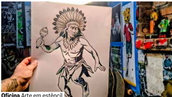
Oficina Arte em estêncil

Inscrições on-line a partir de 27/5, às 18h. A partir de 16 anos.