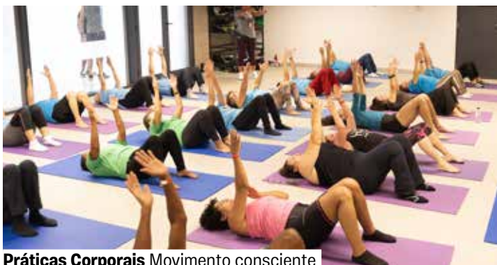
Práticas Corporais Movimento consciente