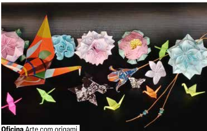
Oficina Arte com origami

Varanda de Múltiplo Uso. Grátis. Senhas 30 min. antes. A partir de 12 anos.