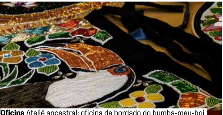
Oficina Ateliê ancestral: oficina de bordado do bumba-meu-boi