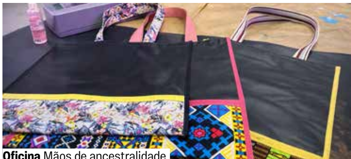
Oficina Mãos de ancestralidade