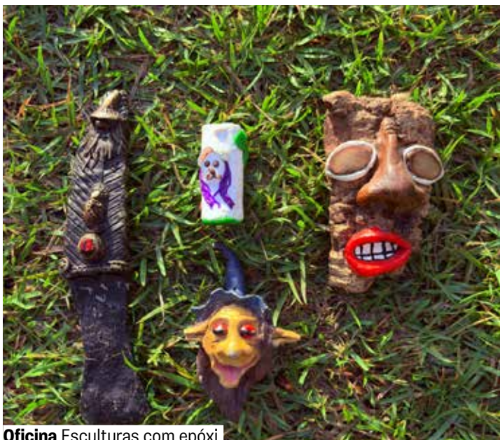
Oficina Esculturas com epóxi