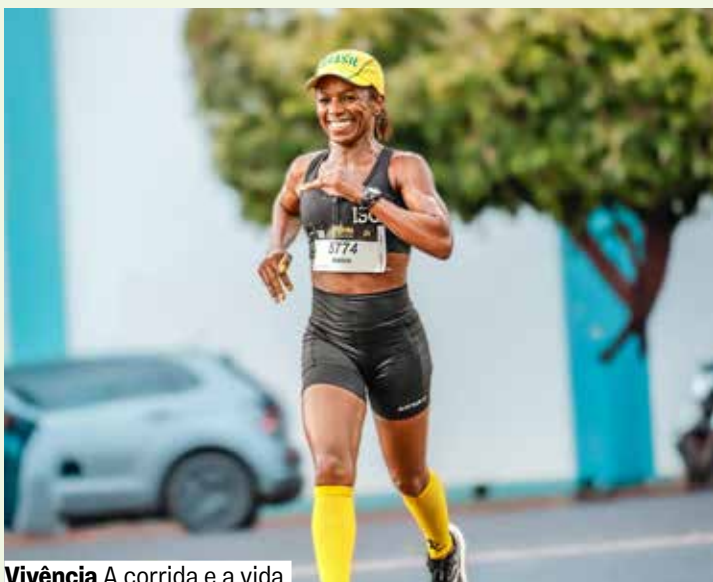
Vivência A corrida e a vida