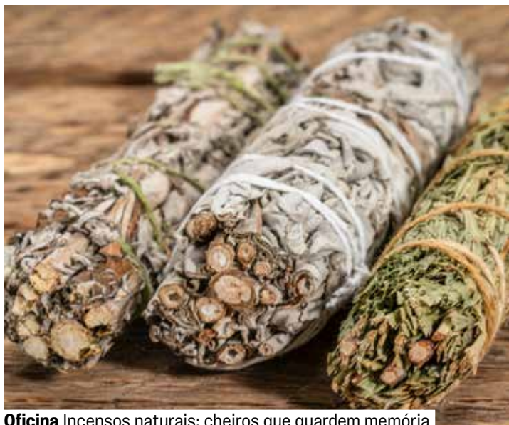
Oficina Incensos naturais: cheiros que guardem memória