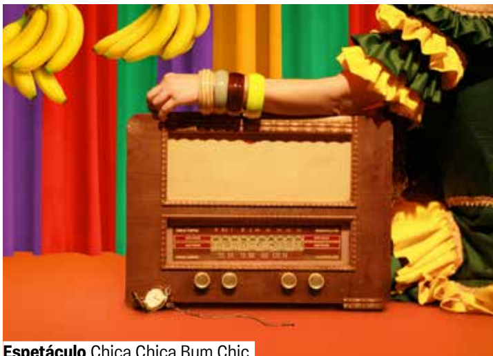
Espetáculo Chica Chica Bum Chic