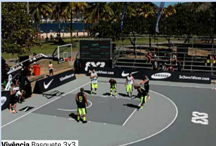
Vivência Basquete 3x3