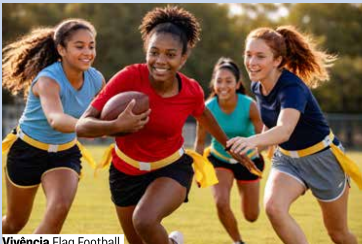
Vivência Flag Football