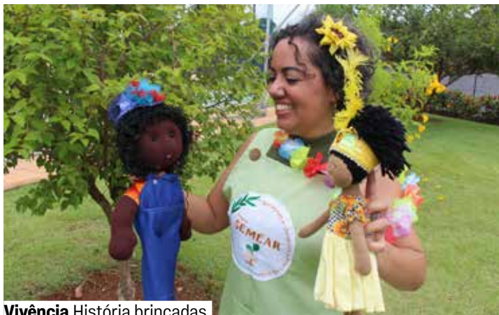
Vivência História brincadas