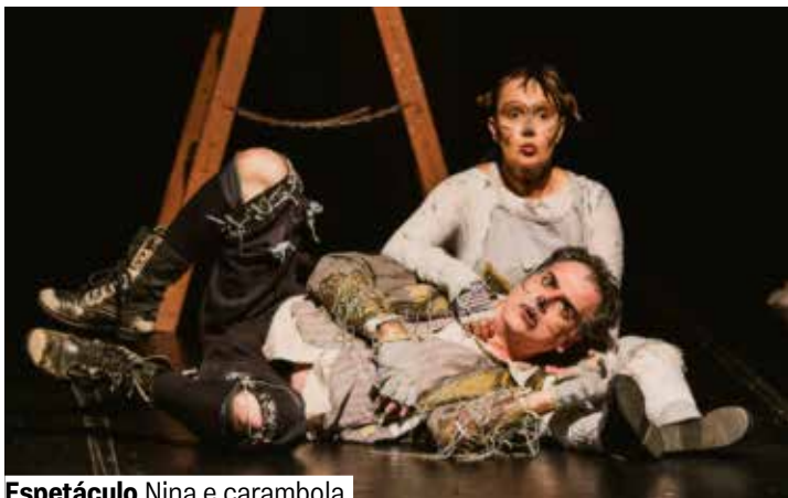
Espetáculo Nina e carambola