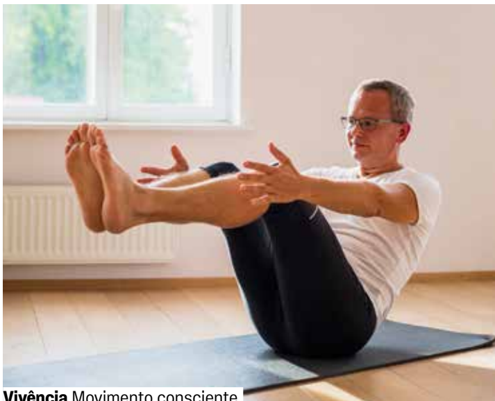
Vivência Movimento consciente