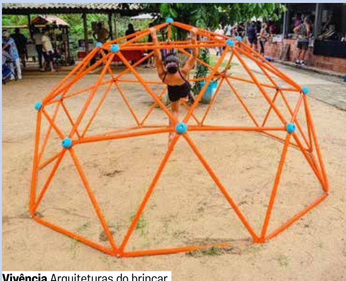
Parque do Bambu