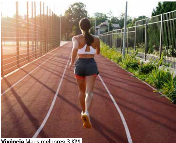
Vivência Meus melhores 3 KM