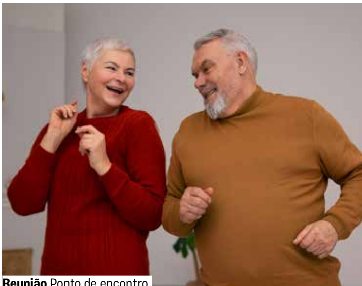
Reunião Ponto de encontro