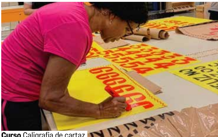
Curso Caligrafia de cartaz