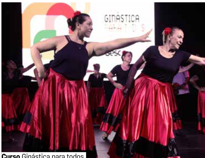
Curso Ginástica para todos