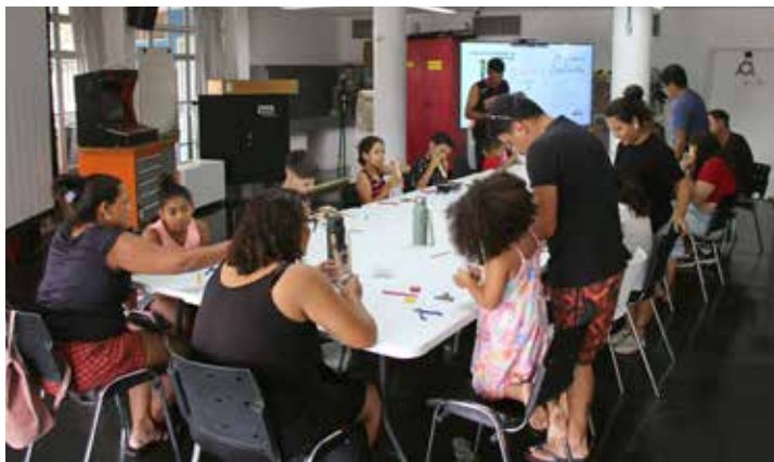
Aula aberta Ateliê Livre de Experimentações Artísticas