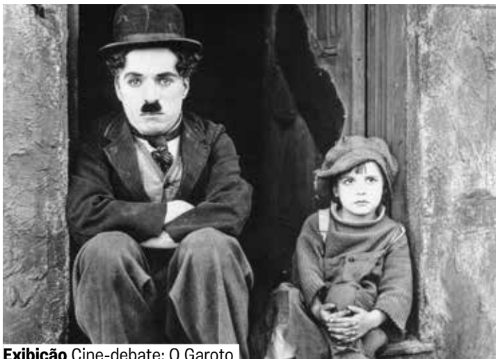
Exibição Cine-debate: O Garoto