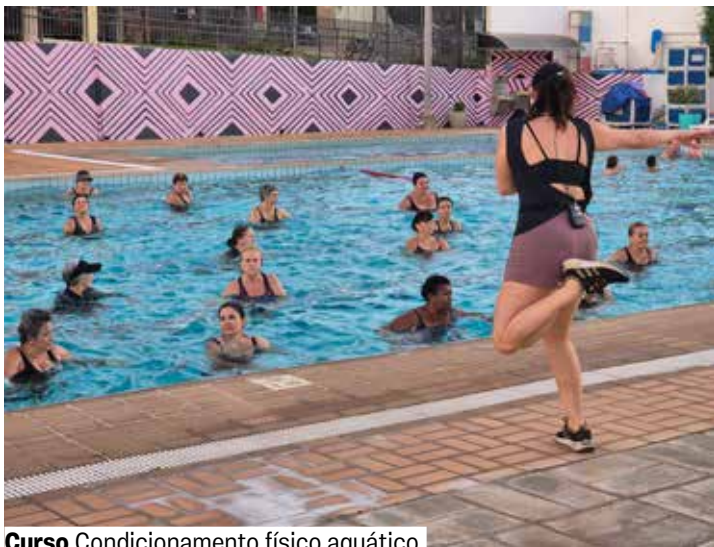
Curso Condicionamento físico aquático