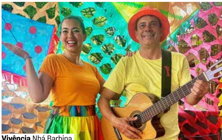
Vivência Nhá Barbina