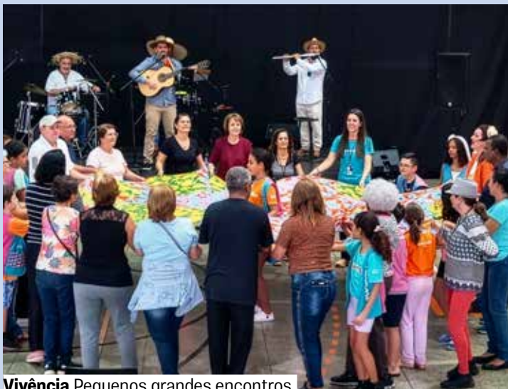
Vivência Pequenos grandes encontros