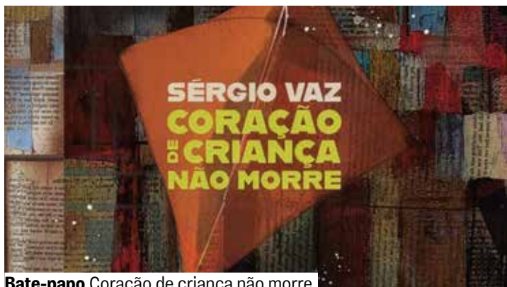
Capa do livro