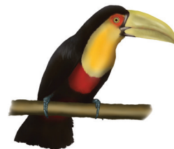
Tucano-de-bico-verde Ramphastos dicolorus 55 cm