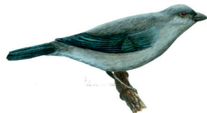
Sanhaço-cinzento Thraupis sayaca 19 cm