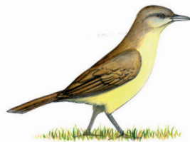
Suiriri-cavaleiro Machetornis rixosa 18 cm