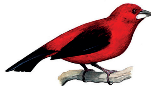
Tiê-sangue Ramphocelus bresilius 19 cm