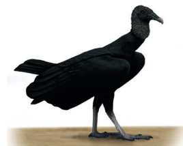
Urubu-de-cabeça-preta Coragyps atratus 74 cm