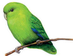
Tuim Forpus xanthopterygius 12 cm