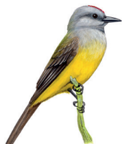
Suiriri Tyrannus melancholicus 21 cm