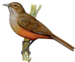
Sabiá-laranjeira Turdus rufiventris 25 cm